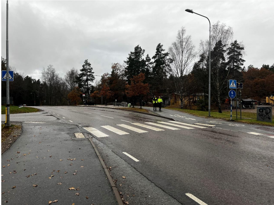
Figur 2. Övergångsställe vid Idunskolan.

Idunskolan med bussfickor och övergångsställe som hindrar för att anlägga fysiska farthinder, därav trafikenheten gjort samma bedömning för dessa in- och utfarter.