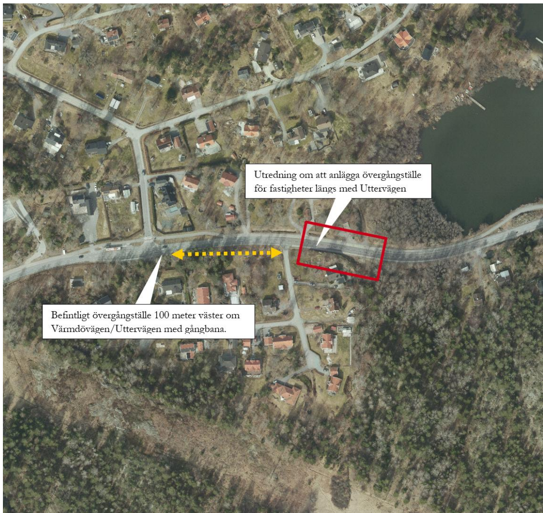
Figur 3. Utredning kring potentiellt övergångsställe vid Värmdövägen/Uttervägen

Det kan slutligen konstateras att trafikenheten stöder avsikten att minska hastighetsöverträdelser med hjälp av fysiska farthinder vid platser som det anses ge störst effekt. Dock anser trafikenheten att sådana åtgärder inte är genomförbara på grund av bristande framkomlighet för kollektivtrafik.