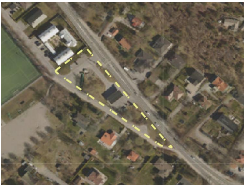
Figur 2, område för stadsbyggnadsprojekt Ältakilen.

Möjligheten att inrätta laddplatser har tidigare stämts av med nätägare som nämnt att det inte finns intresse av att etablera laddplatser om inte platserna kan garanteras i minst 10 år. Därav bedöms det inte finns någon möjlighet att inrätta laddplatser inom fastigheten.