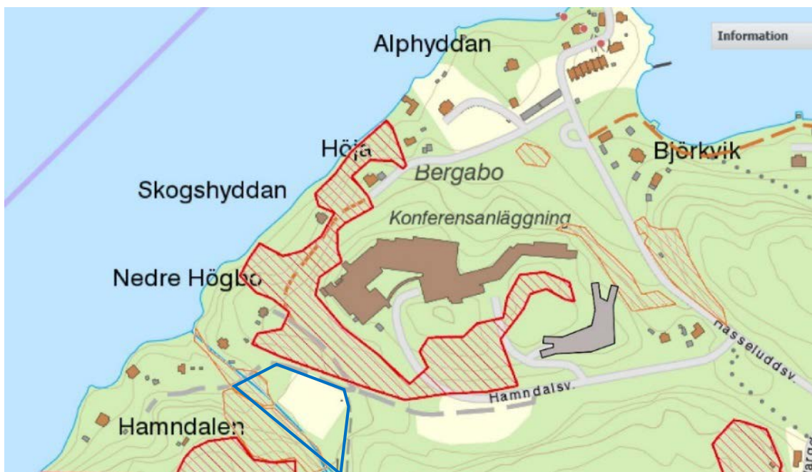
Nyckelbiotopsinventering av Hasseludden. Rödskrifferade områden är nyckelbiotoper. Ljusrödskrifferade områden är något mindre värdefulla och kallas för områden med naturvärden. Blå linje är planområdesgränsen.

Områdets karaktäriseras av högt belägna hållmarker med tall och undervegetation av ljung och blåbärsris med mera. I de lägre fuktigare delarna finns asp, björk och gran. Här finns rikligt med grova träd. Skogsstyrelsen har inventerat området (se karta nedan) och konstaterat att det i direkt anslutning till planområdet finns områden med naturvärden av nyckelbiotopklass respektive naturvärdesklass. Den sydvästra delen av planområdet berör en liten del av ljusskafferat område med naturvärde, som är något mindre värdefull.