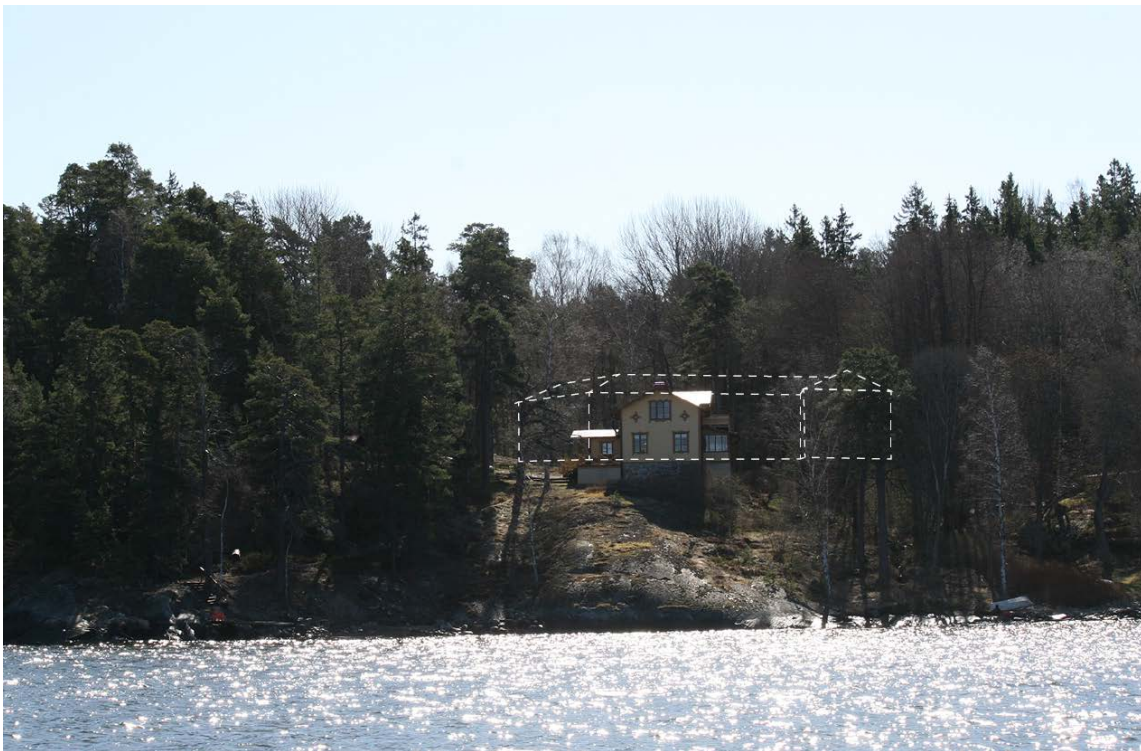
Vy från farleden, som visar att byggnadsvolymen inte kommer att synas från farleden (arkitekter: sr-k)

Bilden ovan visar en illustrerad volym av byggnadens placering, sett från farleden. Byggnaden kommer att vara placerad bakom trädriddån och kommer inte att synas från farleden.