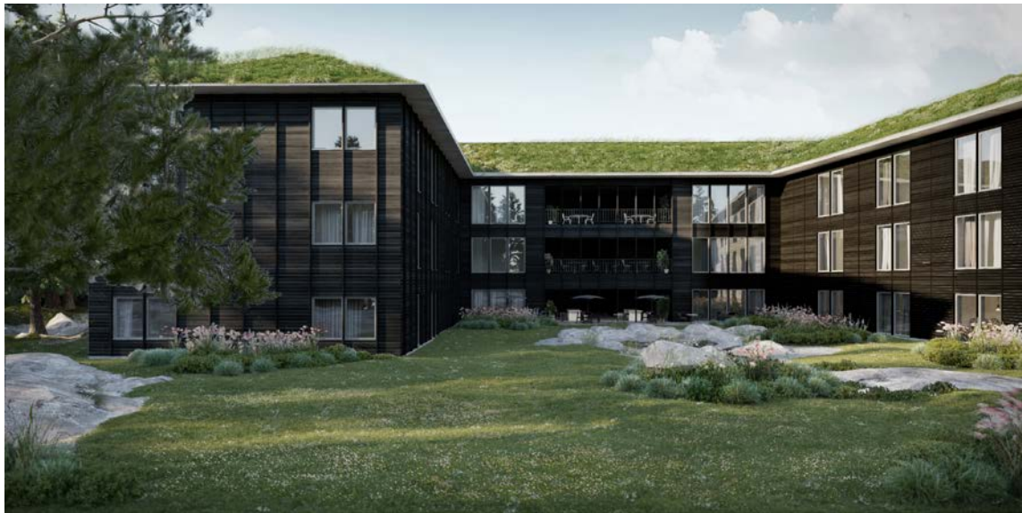
Illustration på innergård, med en möjlig utformning, från sydost (arkitekter: sr-k)