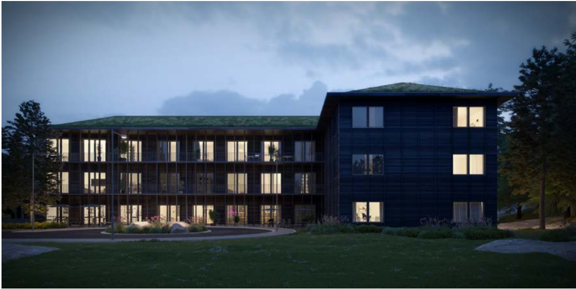
Illustration på entrégård, med en möjlig utformning, från väster (arkitekter: sr-k)