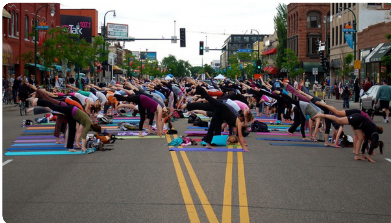
Levande exempel på projekt gjorda av New Yorkbor. Detta finns bland annat i New York och San Francisco där fenomenet går under namnet "tactical urbanism".

På det här sättet blir Nacka en händelserik, rolig och attraktiv plats att vistas i under bygget samt en förebild för andra kommuner vad gäller förtroendet till invånarnas egna vilja att förändra.