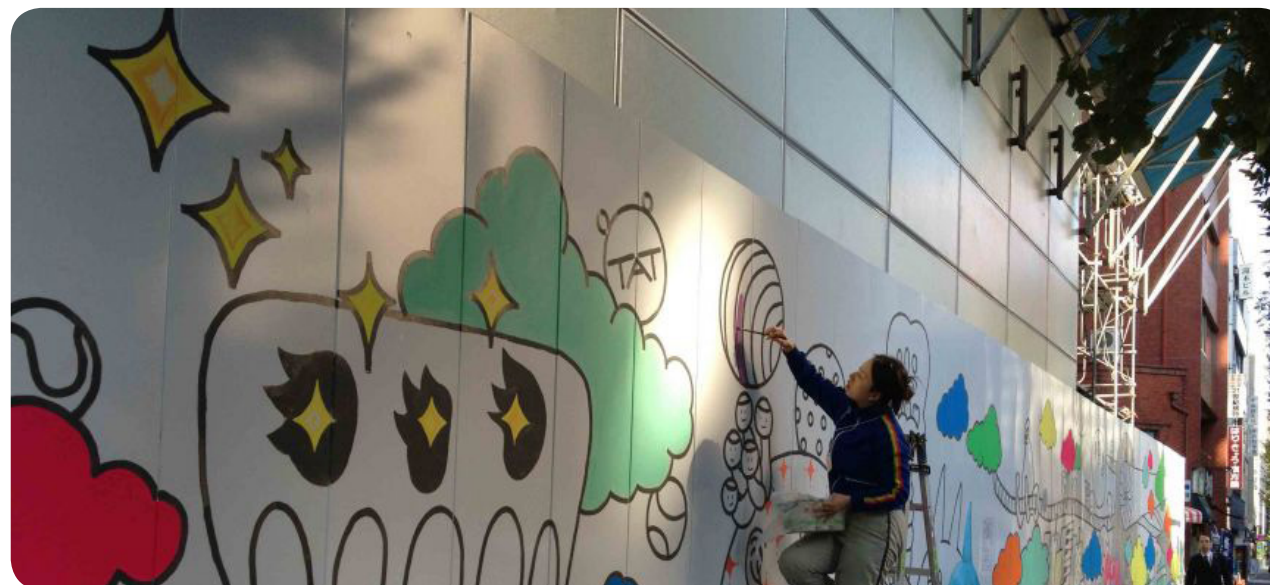
Gatukonst på byggarbetsplats.

Vid de större byggarbetsplatserna ska utsiktstorn placeras ut. Tornen ska vara tillgängliga för alla genom ramper, hissar eller annan konstruktion. Utsiktspplatserna ska erbjuda en möjlighet att se ut över byggarbetsplatsen och man ska få information om vad som görs. Utsiktspplatserna kan när möjlighet finns placeras ovanpå byggbodarna, för att minska byggkostnaderna. För att göra själva byggbodarna roligare kan de målas i Nackas färger.