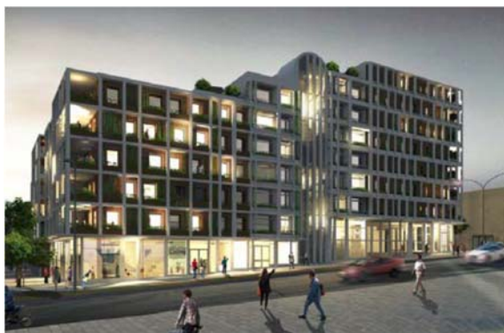
Bostadshus, fasad mot Vikdalsvägen Bild: Kirch och Dereka Arkitekter