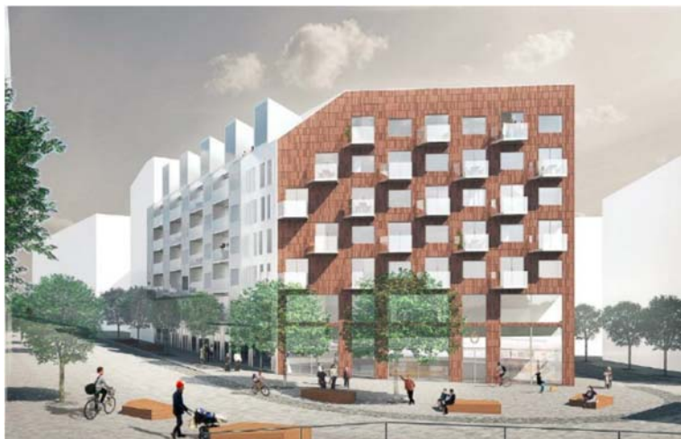
Illustration över torgyta framför byggnad närmast stadshuset Bild: Rotstein arkitekter

Planen innehåller förslag om ett torg i sydvästra området. På platsen sammanstrålar fem olika riktningar, två gator, två trappstråk och ett parkstråk vilket ger goda förutsättningar för en levande plats.