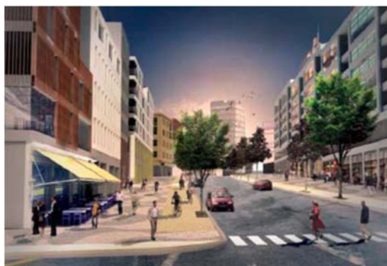
Programillustration för Vikdalsvägen Bild: White arkitekter

I planområdets västra del, vid stadshusets södra fasad, ansluter en promenadväg med befintlig vegetation. Detta grönstråk, som ligger utanför planområdet, ska bevaras och utgöra en viktig koppling västerut mot Eklidens skola och en planerad gång- och cykelväg ner mot Järla skolväg. I stadsparken i direkt anslutning till planområdet planeras plats för lek och rekreation.