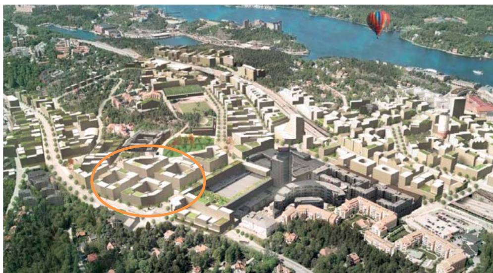
Översiktsbild från detaljplaneprogrammet för Centrala Nacka med planområdet markerat.

Området beräknas kunna inrymma cirka 600 bostäder i flerbostadshus fördelade på fyra kvarter. Bebyggelsen ska ha lokaler för verksamheter i markplan mot angränsande gator, lokaler ska prioriteras särskilt mot gatorna Värmdövägen och Vikdalsvägen. Totalt rör det sig om cirka 8000 kvadratmeter. En föreslagen byggnad invid Nacka stadshus i planområdets västra del där kontorsändamål och viss utbildnings-, kultur- och fritidsverksamhet medges.