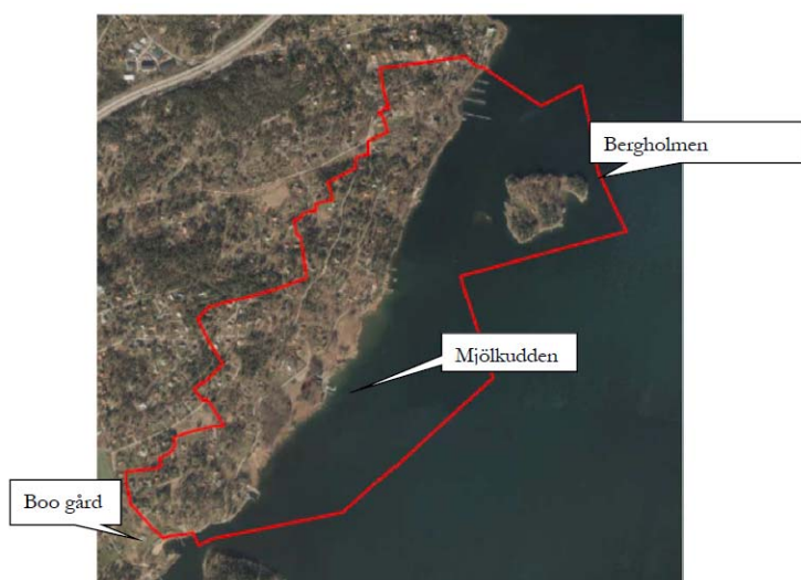
Kartan visar ett flygfoto över detaljplaneområdet i sydöstra Boo.

Planförslaget möjliggör utbyggnad av kommunalt VA och ett kommunalt övertagande av huvudmannaskapet för gator/vägar och övrig allmän platsmark i planområdet. Vidare möjliggörs en varsam förtätning av den friliggande bebyggelsen med hänsyn till områdets kultur- och naturmiljövärden. Planförslaget är utformat för att möjliggöra permanentboende i området vilket bland annat innebär ökade byggrätter. Där det bedömts lämpligt medges även styckningsmöjligheter som kommer ge området en mer förtätad villakaraktär.