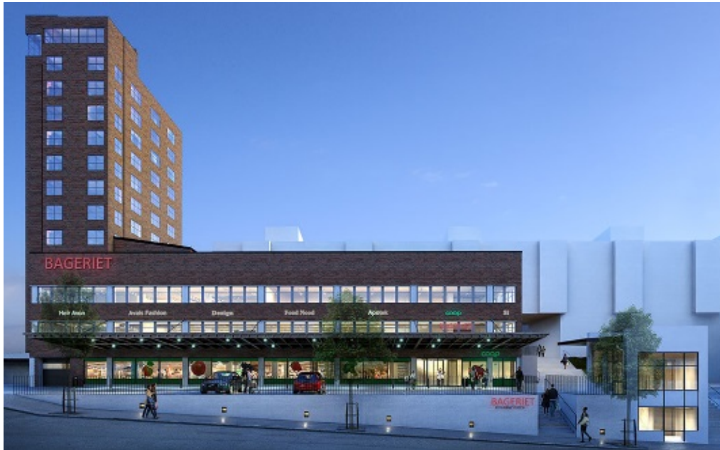
Figur 1: Illustration av närcentrum vid den före detta Spisbrödsfabriken. Källa: www.kvarnholmen.se

Fastighetsägare och byggherre för grundskola, sporthall samt bollplan är Kvalitena AB. Skolverksamhet ska drivas av Ebba Braheskolan AB. Skolan ska öppna sin skolverksamhet i mindre skala i tillfälliga lokaler i före detta Makaronifabriken hösten 2017. Den nybyggda skolan och sporthallen planeras vara inflyttningsklar hösten 2020.