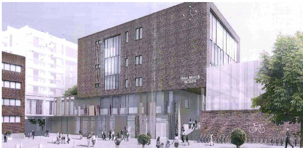
Figur 3: Illustration över framtida Ebba Braheskolan

I den skola som Kvalitena projekterar på Kvarnholmen finns långt framskridna planer på en sporthall på cirka 1 615 kvadratmeter med en 7-spelarplan på taket vars yta är cirka 1 021 kvadratmeter. Sporthallen kommer att anpassas för olika sporter, med anslutande omklädningsrum, förråd och personalutrymmen. En trappa upp i sporthallen finns en aktivitetsyta på cirka 200 kvadratmeter inritad med separata omklädningsrum och förråd.