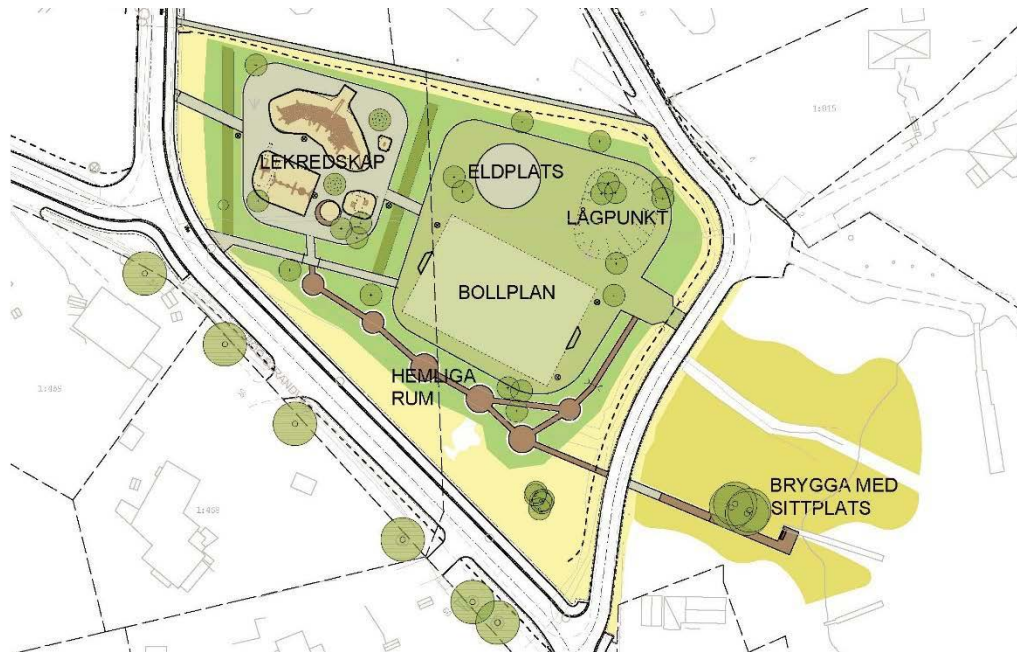
Exempelutformning av parken vid Fiskebovägen (Sigma, 2017).