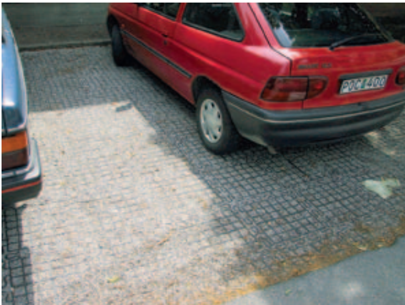
Bild 4. Parkeringsyta med singel som stabili- serats med rasternät av polyetenplast. En långsiktigt hållbar dagvattenhantering, 2004.