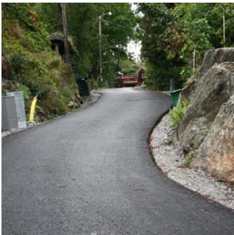
Bild 10. Lokalgata, Lilla Björknäs.

På allmän plats bör dagvatten hanteras och anläggningar utformas i syfte att öka trivseln, skapa vackra miljöer och ge bättre förutsättningar för växt- och djurlivet.