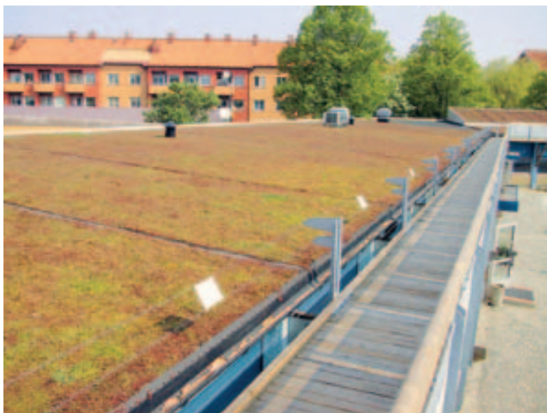
Bild 1. Grönt tak. En långsiktig hållbar dagvatten- hantering, 2004.

Nedan ges några exempel på olika möjligheter till lokalt omhändertagande av dagvatten på privat mark.