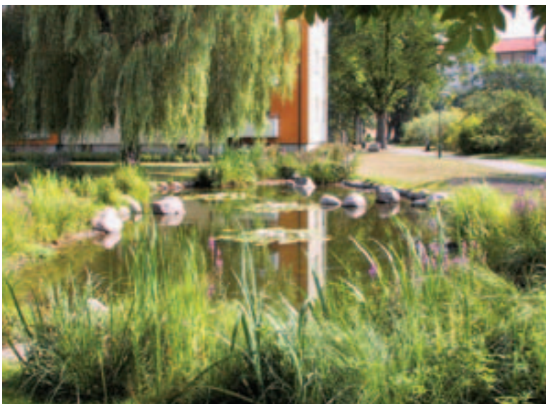
Bild 8. Lokal fördröjnings- damm i ett bostads- område. En långsiktigt hållbar dagvattenhantering, 2004.