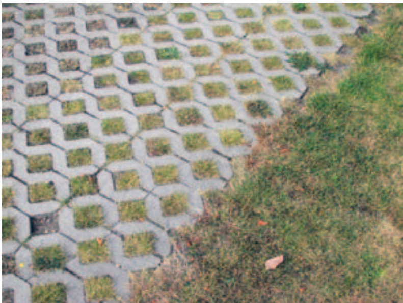
Bild 5. Parkeringsyta med hålsten av betong. En långsiktigt hållbar dagvattenhantering, 2004.