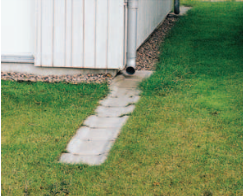
Bild 3. Detaljbild av stuprörsutkastare. En långsiktigt hållbar dagvattenhantering, 2004.