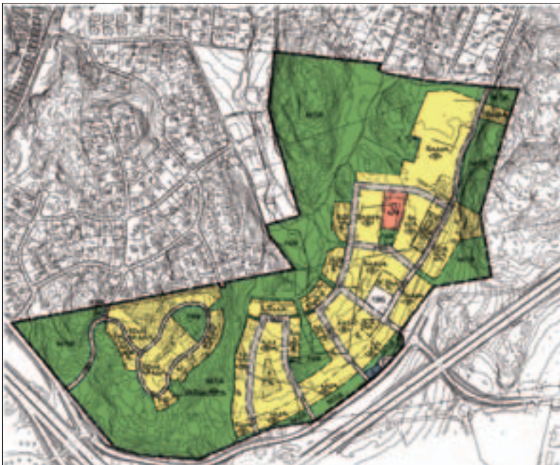
Bild 11. Detaljplan, Södra Hedvigslund