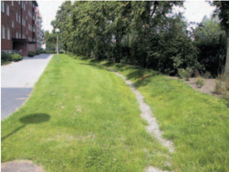
Bild 7. Stensatt svackdike på en skolgård. En långsiktigt hållbar dagvattenhantering, 2004.