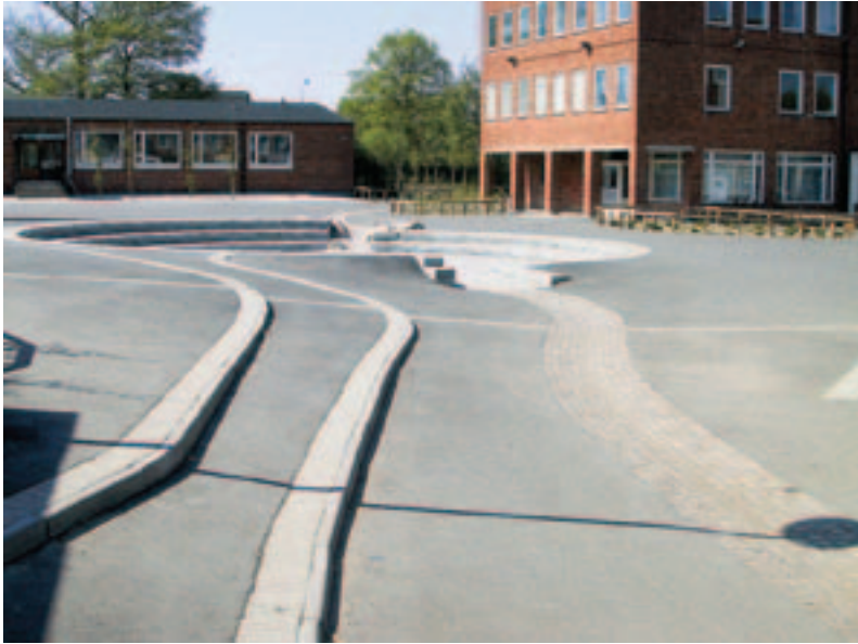
Bild 6. Gräsbeklätt svackdike inom en bostadsfastig- het. En långsiktigt hållbar dagvattenhan- tering, 2004.