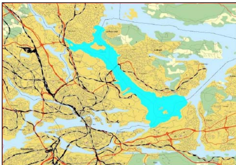
Vattenförekomsten Lilla Värtan

Den ekologiska potentialen är måttlig och den kemiska statusen till uppnår ej god kemisk ytvattenstatus .