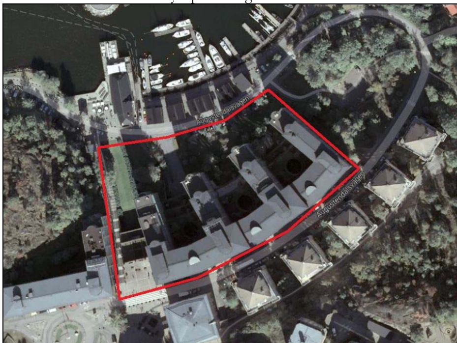
Tolkad detaljplanegräns (Översiktlig dagvattenutredning för hus 13, Sweco 2014-06-04)

I dagsläget avvattnas hela området utan rening direkt ut i Saltsjön. Planförslaget innebär att kontorshus förändras till bostadshus. Andelen hårdgjord yta inom området förblir dock densamma före som efter nyexploateringen.