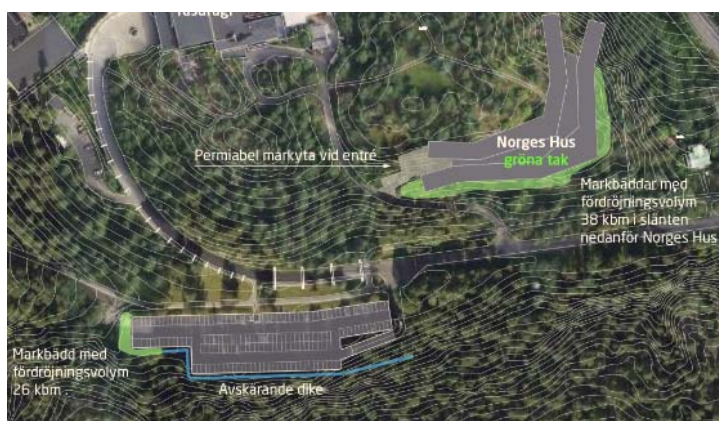
Figur 2 Ytor för hantering av dagvatten

För att nå flödeskraven, under ett 10-årsregn med en klimatkfaktor på 1,2 är den nödvändiga fördröjningsvolymen i Norges Hus område 85 m 3 . Om gröna tak och permeabel beläggning utnyttjas är den nödvändiga fördröjningsvolymen 38 m 3 . Fördröjningsvolymen för parkeringshusets område är 26 m 3 .