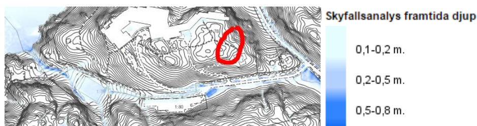
Figur 3 Skyfallsanalys, framtida djup. Röd markering är ungefärligt läge för Norges hus

Ytan där byggnaden planeras är inte utsatt för översvämningsrisk, Hamndalsvägen är sannolikt ett naturligt stråk för dagvatten om stora nederbörds mängder kommer och om diken utmed vägen inte räcker till. Det är viktigt att det i och med den nya byggnaden anläggs tillräckliga fördröjningsmagasin som klarar den normala nederbördssituationen. Dagvattnet får inte bli en störningskälla utanför fastigheten.