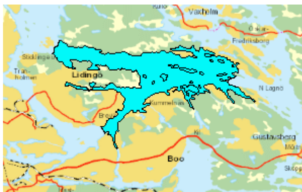
Figur 1 Askrikefjärdens ytvattenförekomst

Miljö kvalitetsnormen (MKN) för Askrikefjärden är att den ekologiska statusen ska vara god ekologisk status med tidsfrist till 2021. Enligt förslag till ny MKN är tidsfristen flyttad till 2027. Enligt det nya förslaget till MKN kommer även den kemiska ytvattenstatusen få en ny klass, och god kemisk ytvattenstatus 2015.