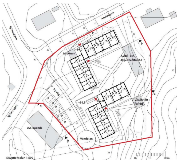
Figur 2. Situationsplan med föreslagen bebyggelse för Älta 109:6. Markanvisningsområdet markerat med rött.