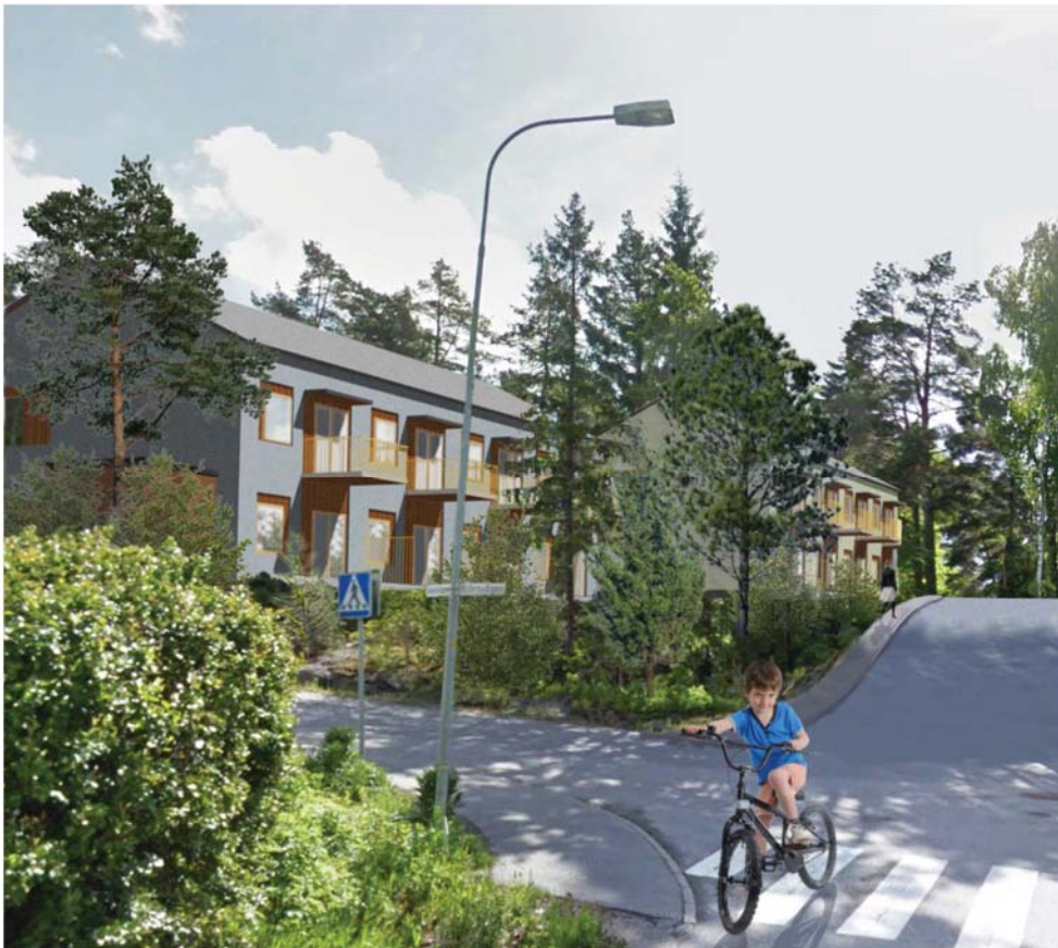
Figur 4. Visionsbild från korsningen Apelvägen/Björnvägen mot markanvisningsområdet. De två buskropparna är lägre och tillbakadragna från gathörnet där naturmark kommer att sparas. (Källa: LINK arkitektur/Sveafastigheter Bostad AB)

Föreslagen bebyggelse innefattar cirka 30 lägenheter om 2-3 rum och kök, med möjlighet att sammanföra lägenheter för att skapa större lägenheter vid behov. Arkitekturen är småskalig med putsade fasader i naturnära nyanser och inslag av trä. De planerade bostadshusen ska uppfylla kraven för passivhus.