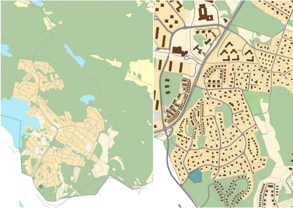
Figur 1. Markanvisningsområdets lokalisering i Älta.