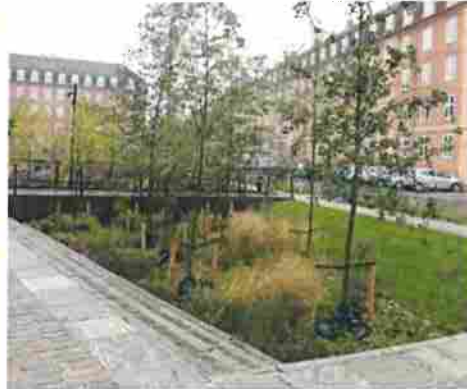
Regnbädd i Köpenhamns Klimat kvarter.