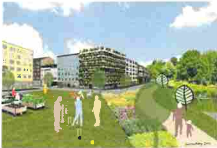
Figur 1 Visionsbild tagen från Fundamenta – grunden för stadsbyggande i Nacka stad .

Rapporten är i linje med kommunens fyra övergripande mål och stödjer särskilt målet Attraktiva livsmiljöer i hela Nacka, samt Nackas miljöprogram 2016-2030. Rapporten är kopplad till och tydliggör även andra strategi-, policy- och visionsdokument, i första hand Nackas dagvattenstrategi, Fundamenta – grunden för stadsbyggande i Nacka stad, Gatustandard – att bygga med moduler, och Grönnytefaktor Nacka stad. Rapporten är en del av Nackas Tekniska handbok. VA-huvudman, Nacka kommunens VA-bolag Nacka vatten och avfall AB är kravställare och rådgivare.