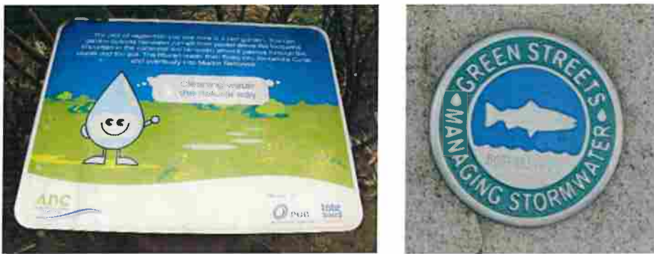
Figur 14. Exempel på informationsskyltar