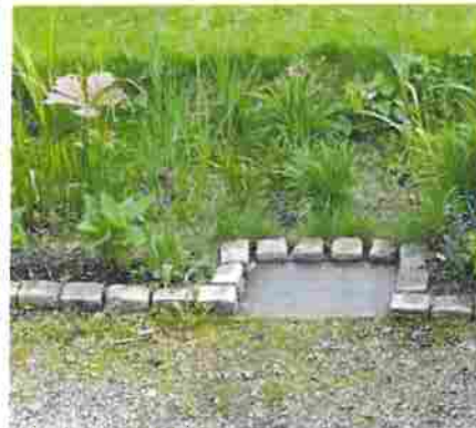
Inlopp till regnbädd med försedimentering, som möjliggör enklare skötsel. Oslo, foto av Bent Braskeerud, Oslo kommune.