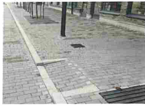
Figur 11. Exempel på utformning av skelettjordar, regnbäddar och olika typer av inlopp, Sverige.