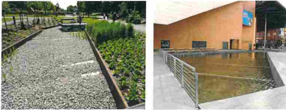
Figur 13 Exempel på torra och öppna dammar på allmän platsmark.