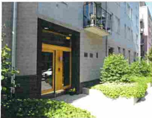
Exempel på regnbäddar för takvatten typ förgårdsmark, Stockholm