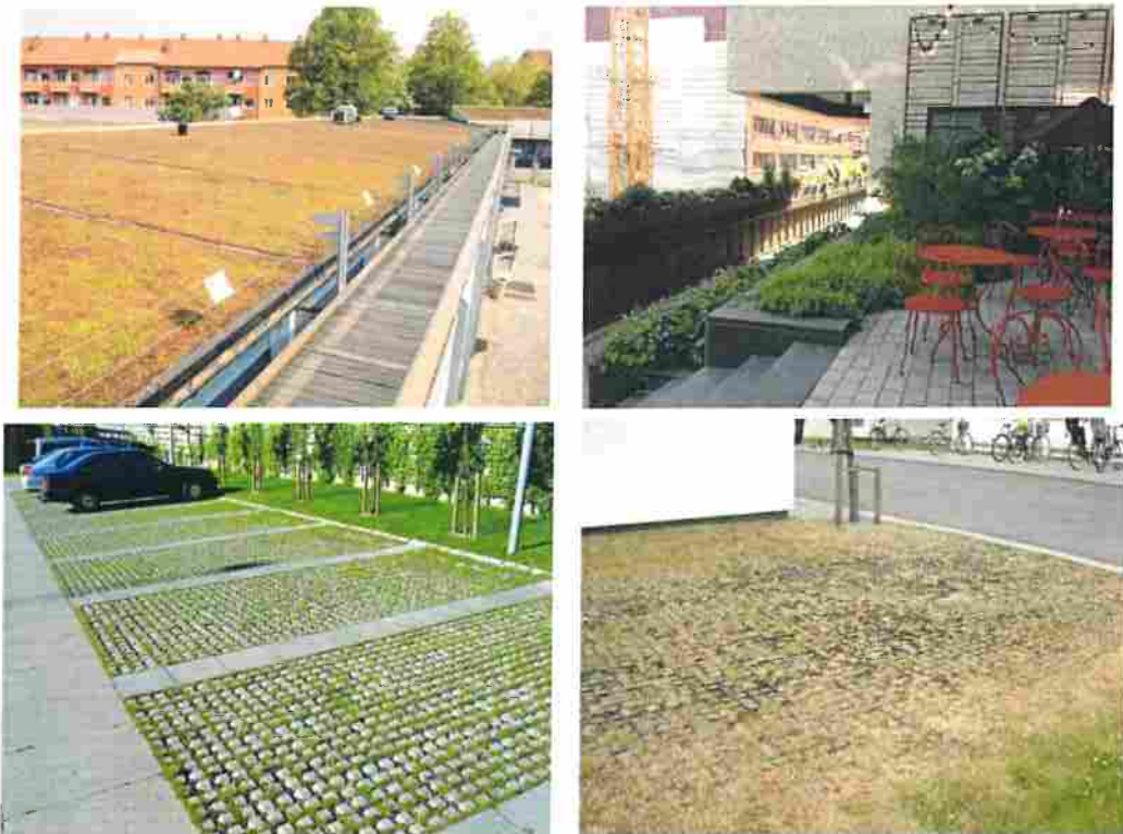
Figur 4. Nedre bilderna visar exempel på genomsläppliga beläggningar för parkeringsplatser och den övre bilden visar en bit av ett grönt tak i Stockholm som även används som en takträdgård.