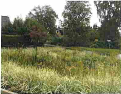
Regnbädd i Tyresö.

Jordbeskaffenhet är helt avgörande för reningens funktion och växternas överlevnad. Växtjorden i regnbädden får inte vara för tät eller finkornig för att kunna ta emot avsedd mängd vatten. Det innebär att jorden torkar ut snabbare under torrperioder och kan kräva ett visst bevattningsbehov i vart fall under de första årens etablering. Ytterst få växter tål att vara översvämmade under en längre tid, för att senare också tåla torka, exempel på sådana växter från den svenska floran är en del våtängsblomster. I de fall växtjorden kompletterats med pimpsten och biokol har det visat sig att jordens både luft- och vattenhållande förmåga har förbättrats. Träd klarar oftast den extrema växtmiljön bättre än perenna växter, eftersom dess rötter efterhand breder ut sig mer och söker sig ner till fuktiga delar av växtbädden. Regnbäddens konstruktion får inte begränsa utbredningen av trädets rotsystem och bör omges av skelettjord. Kravet på rätt utformning och dimensionering av regnbäddens dränering är också av detta skäl väsentlig. Regnbäddar ska generellt inte gödslas men det kan behövas att begränsad gödsling i samband med stödbevattning under växternas etableringstid.