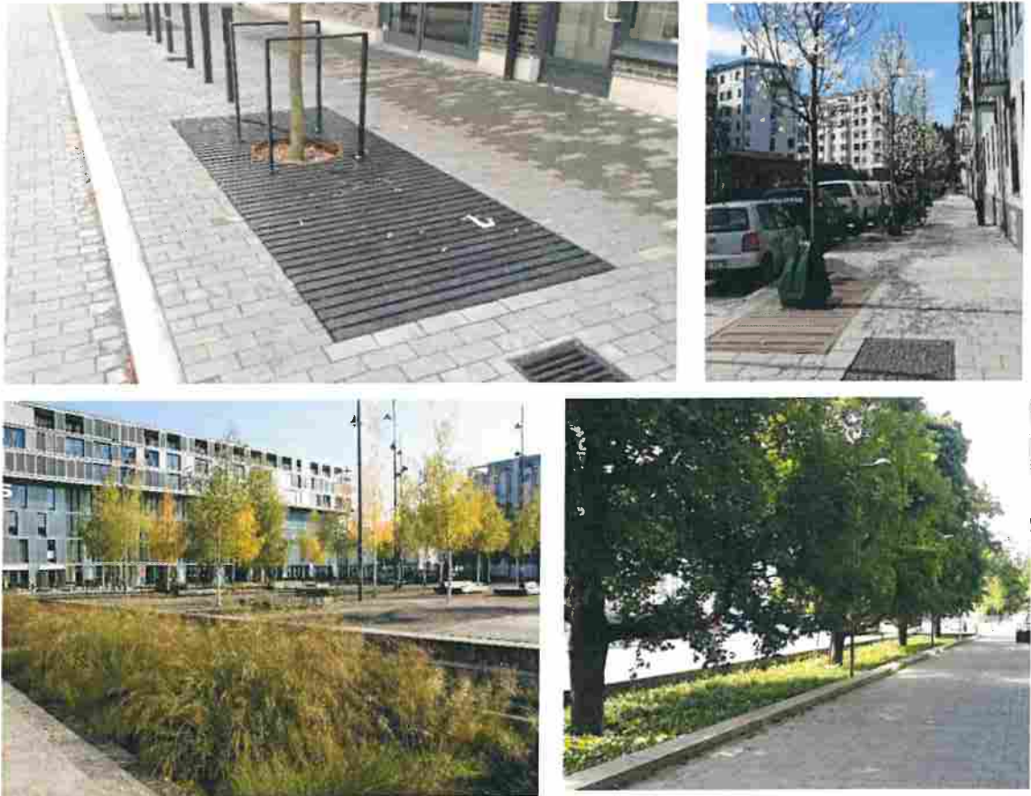
Figur 7 Exempel på öppen och täckt växtbädd i gaturummet, Norra Djurgårdsstaden.

Den lokala dagvattenhanteringen i gaturummet ska om möjligt ske i regnbäddar med gatuträd, vilka är täckta med markgaller eller i vissa fall öppna regnbäddar som planteras med perenna växter (Figur 7). Regnbäddarna kännetecknas av att ha en växtbädd som är nedsänkt i förhållande till omgivande mark så att dagvatten från kringliggande ytor kan ledas in i och infiltreras i växtbädden.