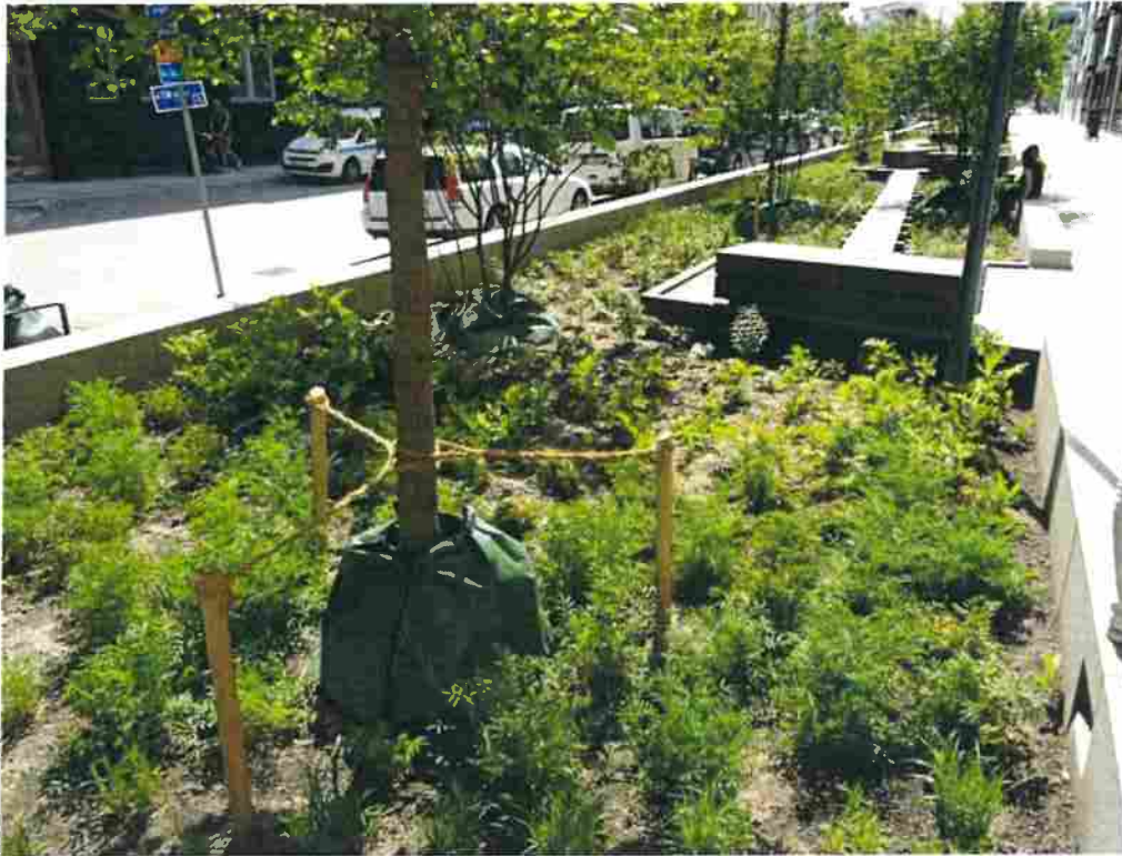
Figur 9. Öppna regnbäddar. Fungerar på liknande sätt, som en täckt regnbädd. En öppen regnbädd kan planteras med perenner, buskar och träd istället för markgaller. Bilden i exemplet ovan är tagen i Norra Djurgårdsstaden.