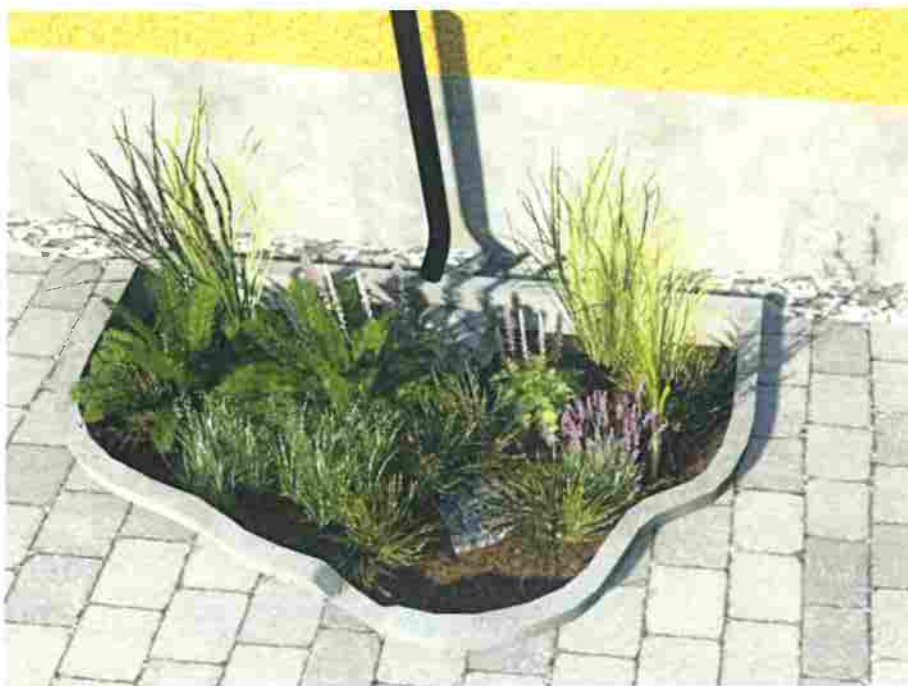
Figur 5. Nedsänkt regnbädd på kvartersmark som kan ta emot dagvatten från tak och markytor. Här dimensionerad för att kunna ta emot 10 mm från en 100 m 2 stor takyta. Inflödet sker via stuprör och släpp i kanten. Överskottsvatten avleds via dränering och bräddbrunn. Alternativt kan en regnbädd utföras i upphöjd form för att då enbart ta emot dagvatten från tak.