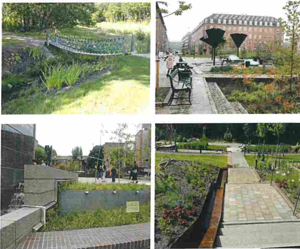
Figur 12. Exempel på dagvattenhantering i nedsänkta växtbäddar och avrinningsstråk på allmän platsmark.

Avrinningen från parker och torg ska uppfylla anvisningarna för dagvattenhantering. Fördröjning görs i exempelvis i regnbäddar med formgivna avrinningsstråk (Figur 12) samt i torra och våta dammar (Figur 13).