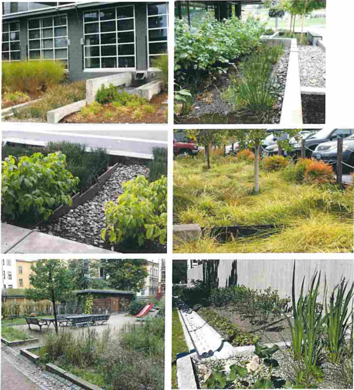
Figur 6. Bilderna visar exempel på seriekopplade regnbäddar på kvartersmark samt exempel på överfall och dämmen. Rännor kan avleda dagvattnet till regnbäddar men även fungera som bräddning i ett seriekopplat system. Exempen kommer från Portland, Oslo och Stockholm.