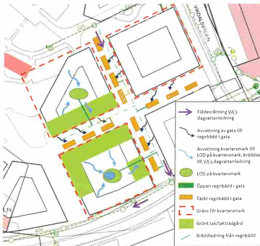
Figur 3. Ex på dagvattensystemets principuppbyggnad i Nacka Stad.