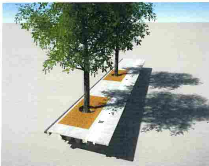
Figur 8. Täckt regnbädd i gata. Dagvatten från GC-bana leds in via luftningsbrunn med sandfång och perforerad sida till luftigt bärlager (t v i övre bilden) ner i skelettjorden som anläggs intill regnbädden. Dagvatten från väg leds via inloppsbrunn med sandfång (gul) till nedsänkt regnbädd som är täckt med markgaller eller plåt. Inloppsröret mynnar några centimeter över växtbädd. Överskottsvatten avleds via dränering och bräddbrunn.