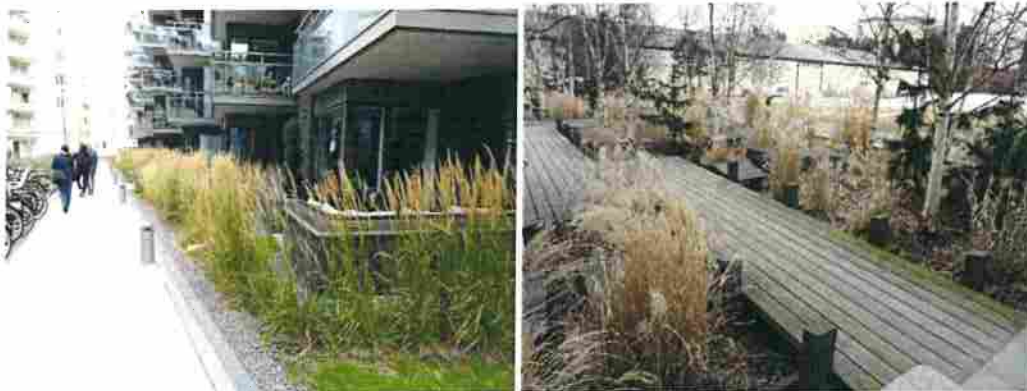
Figur 10. Ett annat alternativ är att dagvatten avledas till regnbädden över en nollad kantsten eller hål eller uttag i kantstenen. Räcken eller planteringsskydd behövs ofta avgränsa en öppen regnbädd av säkerhetsskäl.