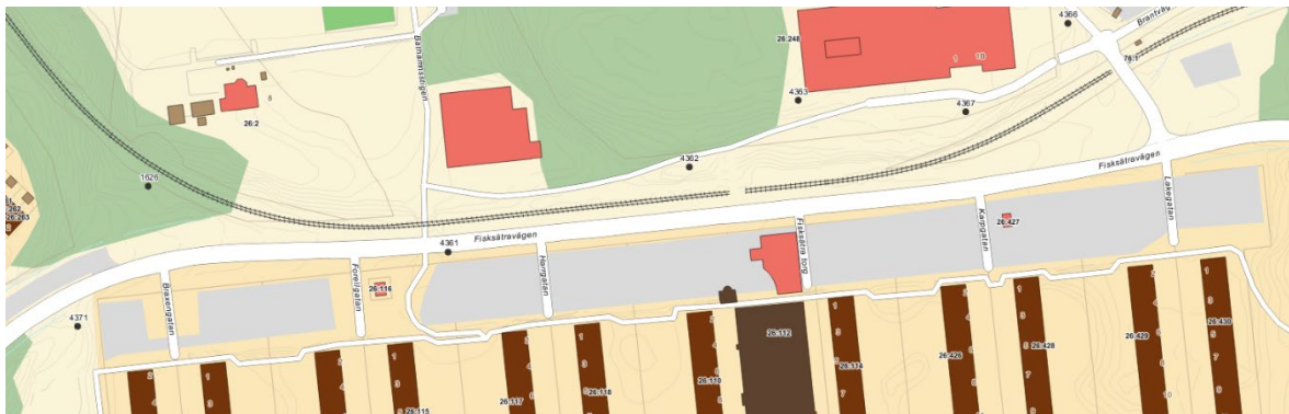
Figur 1: Befintliga stompunkter

Nacka kommuns lantmäterienhet utförde 20191125 en inventering av befintliga stompunkter inom bebyggelseområdet för detaljplan Fisksätra entré dnr KFKS 2017/746. Resultatet från inventeringen visar att alla punkter inom området finns kvar. Punkt 1626, 4371 och 4361. Övriga punkter ligger utanför Bebyggelseområdet och har ej inventerats.