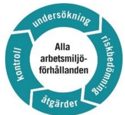
Bilaga 1 SAM-hjulet, AFS 2001:1

Till stöd för kommunens chefer och medarbetare finns bland annat en dokumenterad checklista vid kränkande särbehandling och trakasserier, och en rutin på Nacka kommuns hemsida för att rapportera och hantera tillbud samt arbetsskador i systemstödet KIA.