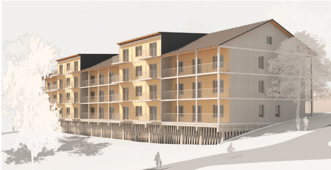
Bilden redovisar förslag på utformningen av bebyggelsen inom Sicklaön 73:49 och 73:50. Bostadsbebyggelsen har ritats av DinellJobansson arkitekter.

Vidare för den tillkommande byggrätten, på det befintliga flerbostadshuset, har en varsamhetsbestämmelse tagits fram som innebär att tillbyggnad eller påbyggnad ska utföras varsamt gentemot de värden och karaktärsdrag som 1940-talsbyggnaden bevarar. Bebyggelsen planeras också utföras med stor hänsyn till de träd som är utpekade i framtagna trädinventering, genom att betydelsefulla träd säkerställs med planbestämmelse.