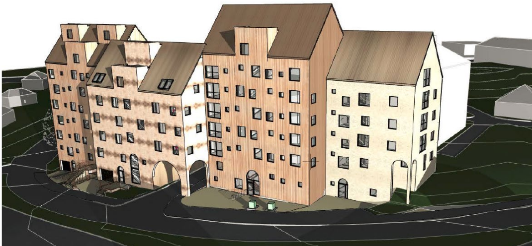
Bilden redovisar förslag på utformningen av bebyggelsen på Sicklaön 73:119 och 40:14. Bostadsbebyggelsen har ritats av Kirsh + Dereka Arkitekter.

På fastigheterna Sicklaön 73:49 och 73:50 regleras byggnadens utformning i plankartan med gestaltungsbestämmelsen "f 2 ". Bestämmelsen hänvisar till gestaltungsprinciper i planbeskrivningen. Planbestämmelse f 2 innebär: