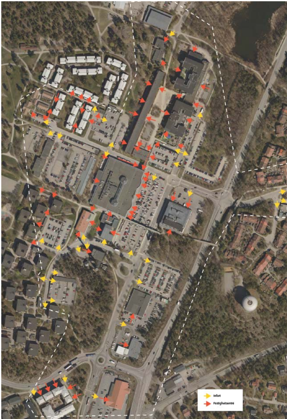
Översiktlig vy över infarter och fastighetscentréer.