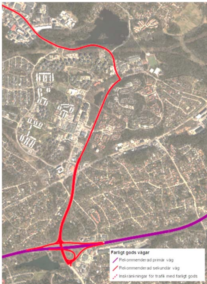
Rekommenderade vägar för farligt gods