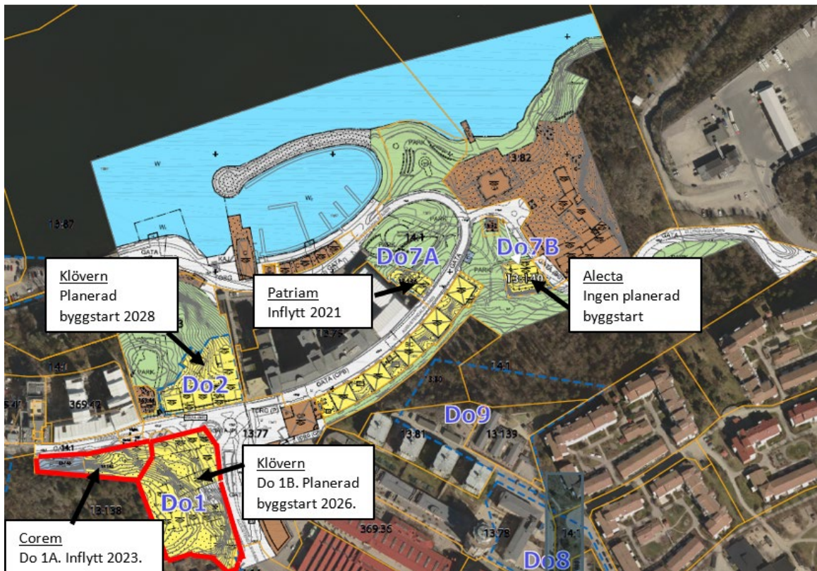
Bild 2: Visar delområden markerade med blå begränsningslinje. Delområden inom delområdena är markerade med röd begränsningslinje.

Fastighetsägarna inom delområde 1A företräds av Corem AB, under varumärket Tobin Properties, och byggnation pågår för 60 nya bostäder och lokaler för verksamheter. Fastighetsägaren i delområde 1B företräds av Klövern AB vilka planerar att bygga cirka 383 lägenheter och verksamhetslokaler vilket överskrider antalet tidigare uppskattade lägenheter. Fastighetsägaren i delområde 2 företräds också av Klövern AB och den befintliga kontorsbyggnaden planeras att eventuellt rivas och ersättas med ett bostadshus för cirka 350 bostäder och 300 kvadratmeter för verksamheter. Inom delområde 7A har Patriam AB byggt 14 lägenheter och verksamhetslokaler som färdigställdes 2021. Delområde 7B omfattar en byggrätt för flerbostadshus om cirka 15-20 lägenheter och ägs av Alecta AB. Det finns ingen planerad byggstart för delområde 7B.