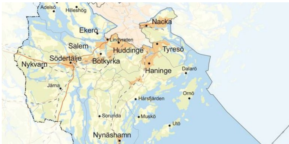
Figur 1. Verksamhetsområde Södertörns brandförvarsförbund

2010 - Nacka kommun gick med i förbundet