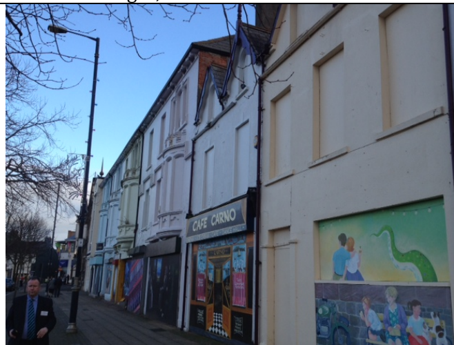
Dekorerade fasader i väntan på ombyggnation.