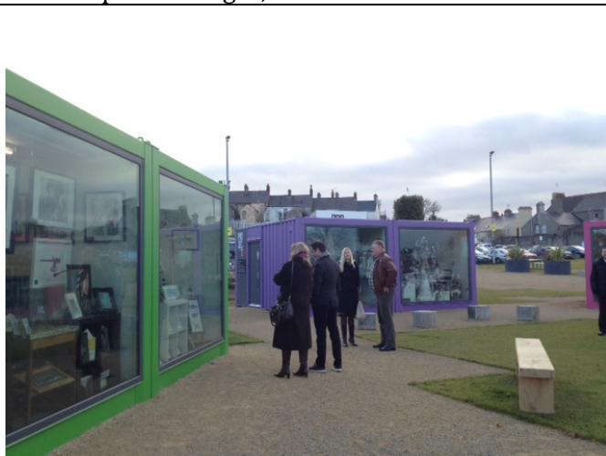
Containrar som ateljéer för att lyfta tillfällig plats.