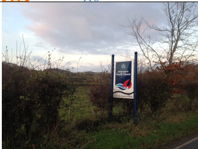
Landskap runt Bangor, North Down