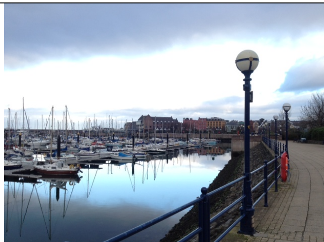
Hamnen i Bangor, North Down