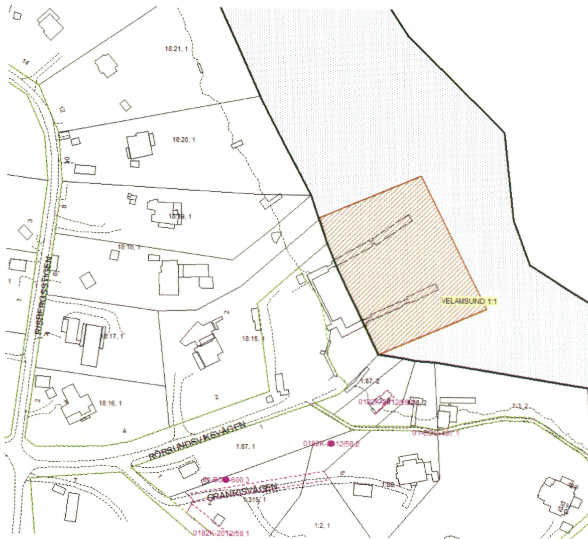
Denna karta tillhör avtal om lägenhetsarrende mellan Nacka kommun och Risets båtklubb