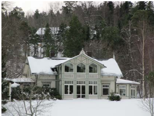
Fagernäs sett från Velamsundsviken. Foto 2010