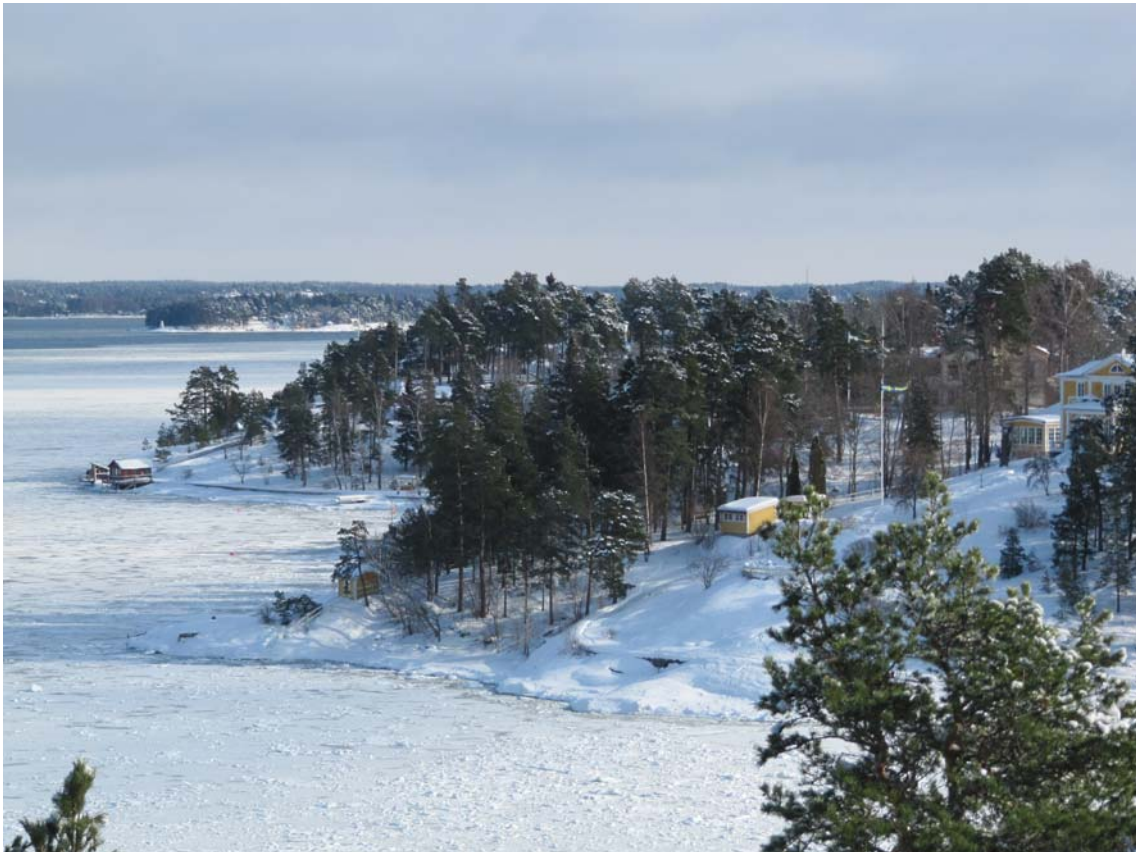
Rösundaöns norra strand mot farleden sedd från Risbergets utsiktsplats. Till höger syns Almdalens gula huvudbyggnad och i mitten den vik "Viken" vars äldsta fastighet lär ha hetat Vikenshill som så småningom blev Vikingshill och namnet på hela ön. Foto 2010

inte omfattas av denna översyn med några få undantag utmed Velamsundsviken. Utredningen gör inte anspråk på att kulturhistoriskt klassificera samtliga fastigheter enligt en flergradig skala. I princip handlar det om att lyfta fram byggnader som faller under plan- och bygglagens 3 kap 12 §, alltså objekt som kan betraktas som särskilt värdefulla eller "omistliga" med betydande historiska, arkitektoniska och miljömässiga värden. Några få hus som har betydelse för miljöbilden men som inte kan räknas som särskilt värdefulla tas också med. Denna utredning är en förkortad version av ett internt arbetsmaterial som även angav förslag till planbestämmelser.