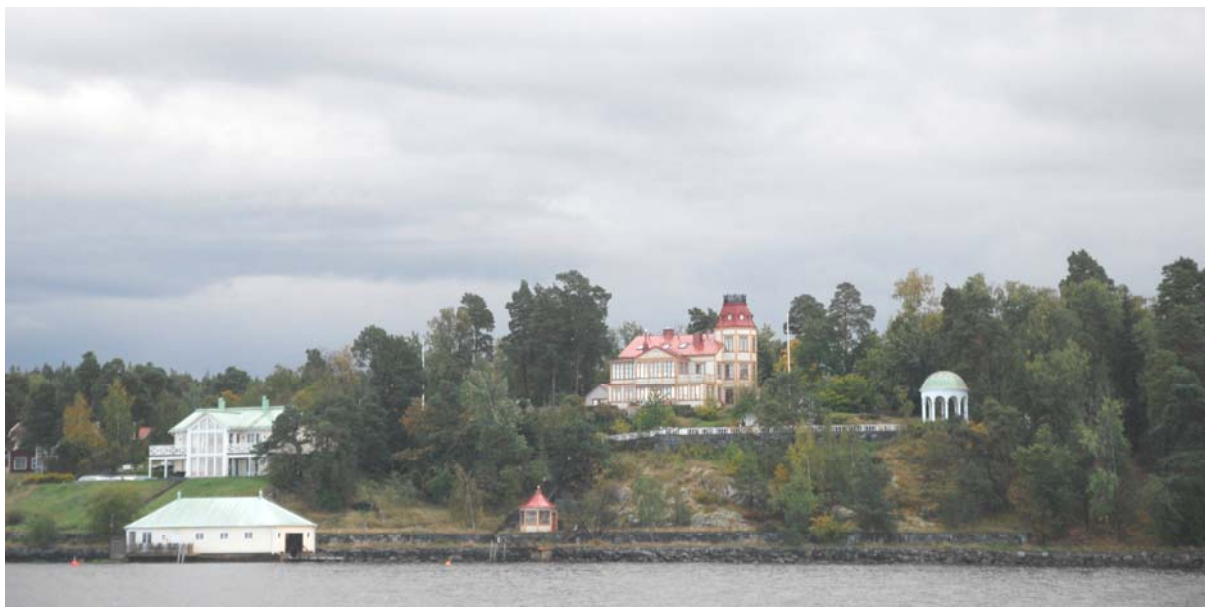
Karlshills tomtbild sedd från farleden. Till vänster båthus nedanför nybyggd villa. Båthuset, som ligger på Almdalens mark, har en karaktär från 1900-talets första årtionden. Det lilla strandnära lusthuset finns inte på ett foto från 1980-talet i Pihl Atmers bok Sommaröjet i skärgården (sid 189). Foto 2009