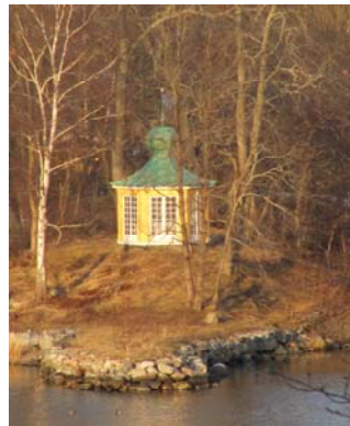
Almdalens lusthus. Foto 2010