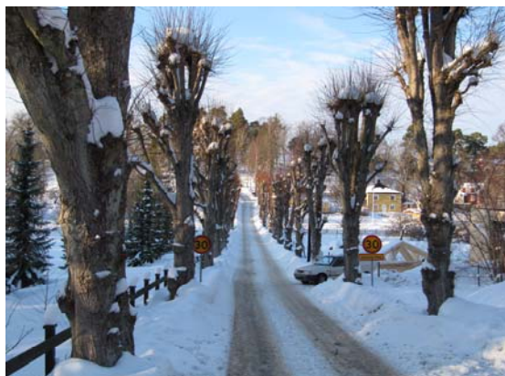
Almdalsvägens lindallé ger miljön en herrgårdsprägel. Foto 2010