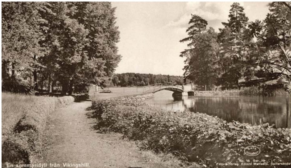
Strandpromenaden enligt äldre vykort