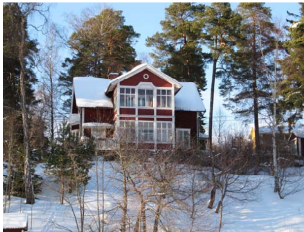
Röda stugan. Foto 2010

Faluröd rektangulär villa i lite enklare schweizerstil från omkring 1887, eller möjligen ombyggd detta år. Uppges ha varit tvåfamiljsvilla, nu enfamiljsvilla. Tidstypisk detalj är vindsvåningens stående panel som avslutas nedtill av utsågade spetsar/uddar. Inglasad tvåvåningsveranda med ganska stramt utseende. Fastigheten är en del av helhetsmiljön vid Marens norra strand.