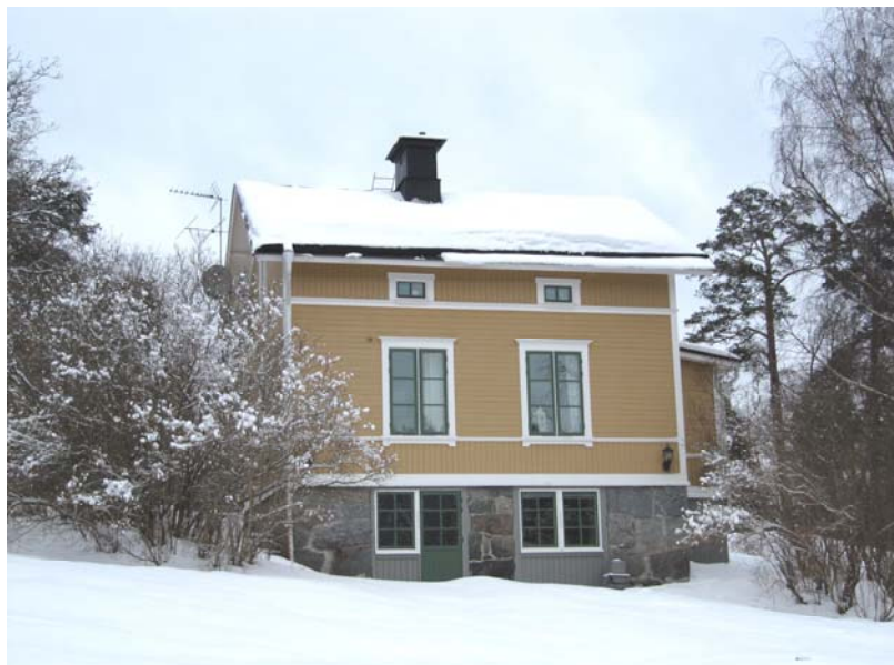
Björkuddens trädgårdsmästarbostad, fasad mot vägen. Foto 2010

I byggnadsinventeringen från 1978 anges huset som trädgårdsmästarbostad under villa Björkudden, kallas också för "Björkuddens annex". Köksträdgård fanns då ännu kvar. Byggnadsår uppges inte, men korsplanlösningen med mittplacerad skorsten samt exteriörens panelarkitektur förekom under det sena 1800-talet. Enligt uppgift är huset uppfört av snickare Granqvist och inrymde från början fyra rum och kök. Efter att Björkudden hade förvärvats av Franska skolan 1934 blev huset bl a gästbostad. Huset har nu moderniserats och byggts ut på baksidan, men den äldre karaktären är välbehållen.