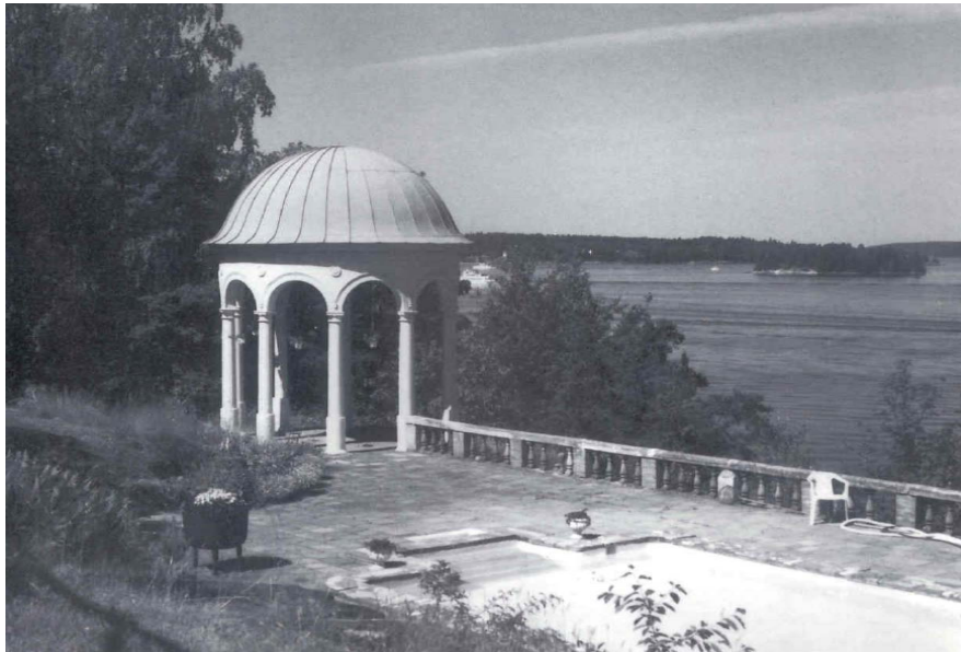
Karlshills ekotempel med terrass mot Höggarnsfjärden. Foto Laszlo Sallay 1994. Nacka lokalhistoriska arkiv