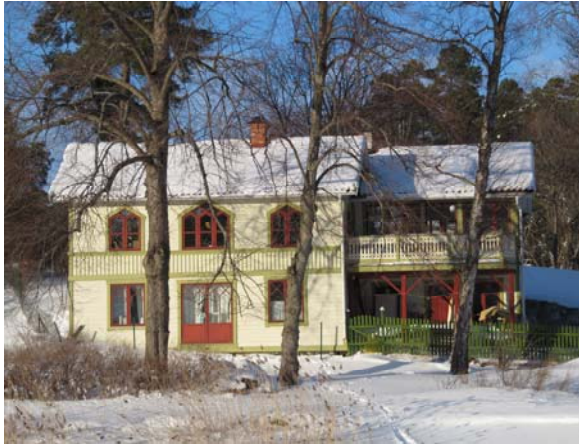
Björkuddsvägen 12, fasad mot Maren. Foto 2010

Trots att huset genomgått en grundlig upprustning/förnyelse och byggts ut så har detta gjorts så att ursprunget fortfarande kan avläsas med ambitiös nivå på detaljutförandet. Huset har ett sjönära läge, med betydelse för landskaps- och bebyggelsebild, samt är som historisk markör en viktig komponent i Rösundaöns helhetsmiljö.