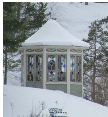
Fagernäs lusthus. Foto 2010