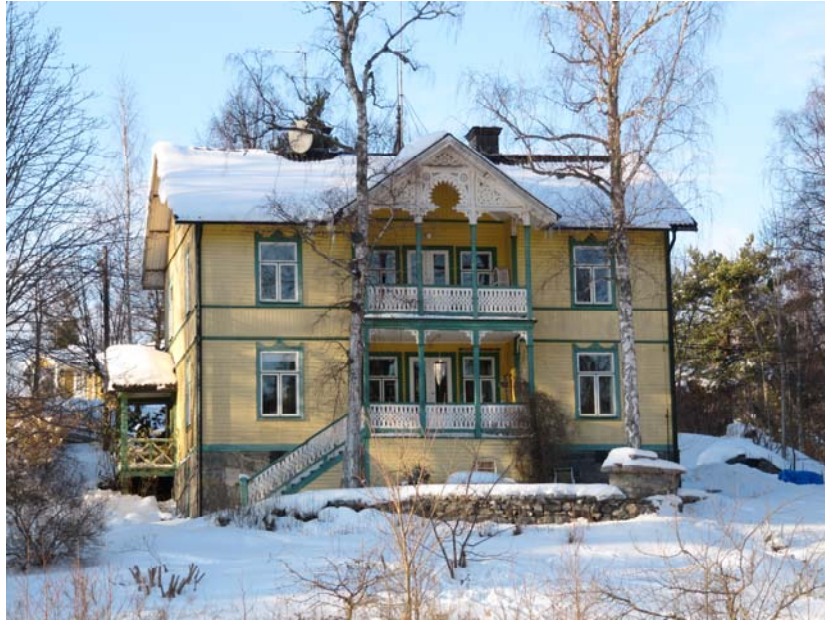
Gustavslund från 1889, fasad mot Maren. Foto 2010