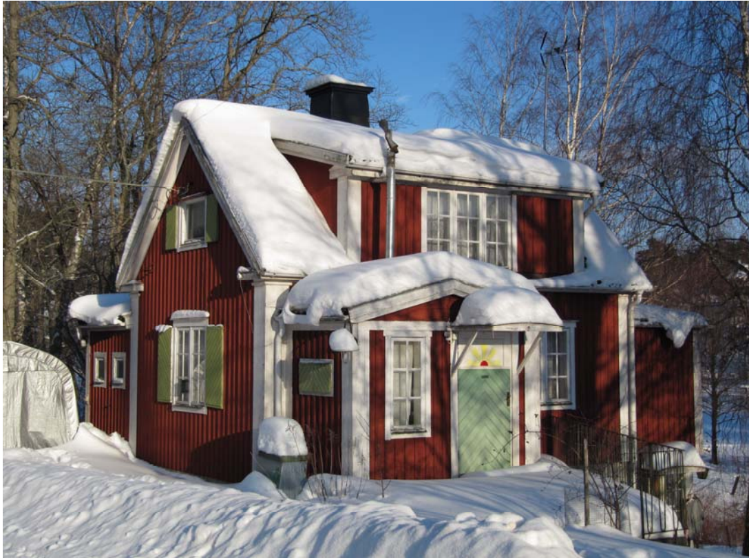
Stuga vid Björkuddsvägen 2. Foto 2010

Stuga av okänt ursprung med drag av nationalromantik från tidigt 1900-tal. Platsen kan ha varit bebyggd redan under 1800-talets slut. Huset ligger nära Björkuddsvägen med värden för väg- och bebyggelsebildan.