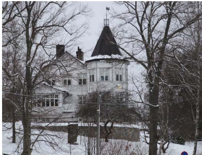
Villa Sommarbo. Foto 2010

Villa Sommarbo är en nybyggd, fri tolkning av en 1880-talstornvilla som stått på fastigheten. Ann Katrin Pihl Atmer menar att Sommarbo var en av den inre skärgårdens "allra ståtligaste anläggningar". Av detta anas än idag av den stora tomtens parkliknande karaktär. Själva huset har alltså inga direkta kulturvärden men utformningen signalerar tillsammans med trädgården platsens historia och sätter en prägel på bebyggelsebilden.