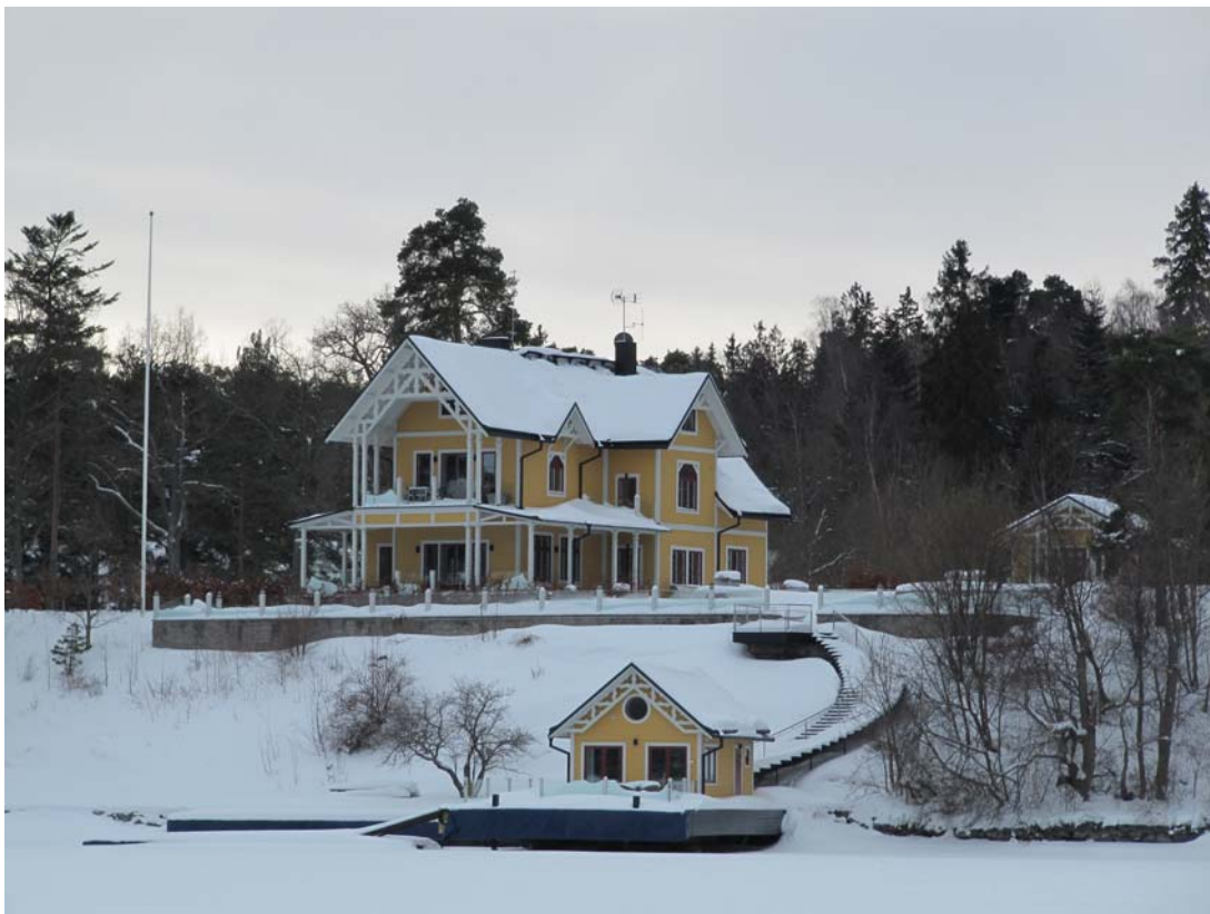
Stugan sedd från Velamsundsviken. Foto 2010