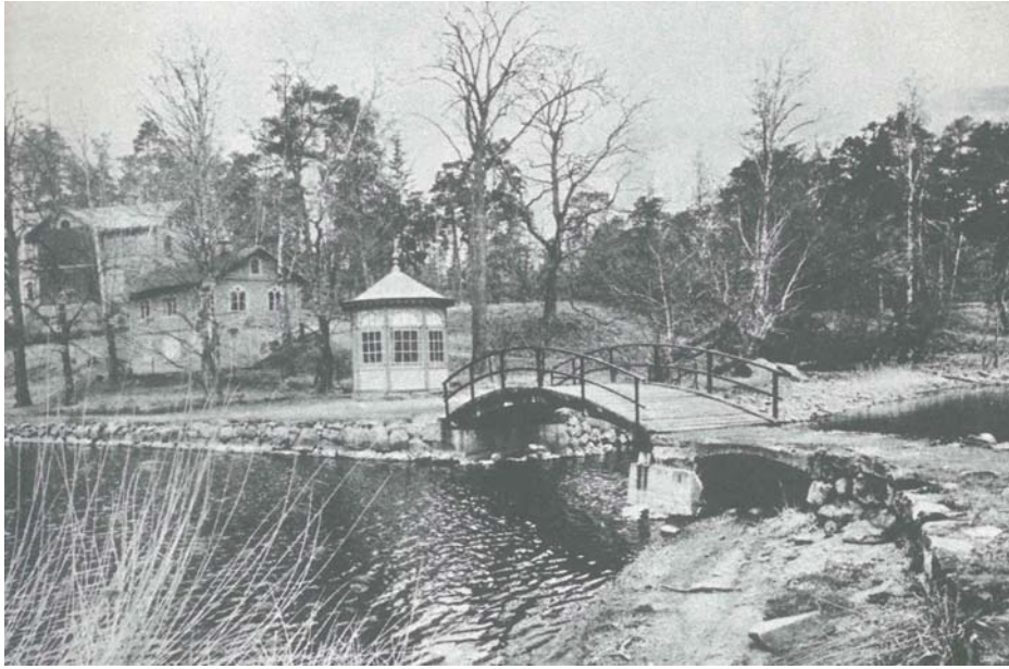
Bild ur Per Wästbergs bok Sommaröarna (1973) som visar lusthuset och bron som revs 1978. Per Wästberg benämner lusthuset för kräftpaviljong. Till vänster Björkuddens tvättstuga och Gustavslund.