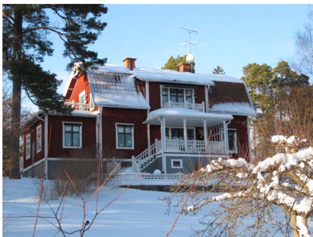
Tomtebacken, fasad mot Björkuddsvägen 2010

Enligt 1978 års inventering är villan uppförd 1904 av byggmästare Oscar Nycander. Den utgör ett intressant exempel på hur schweizervillan under de första åren av 1900-talet fått drag av både jugend och nationalromantik. De nya stilinfluserna representeras av den faluröda fasadfärgen och stramheten i detaljerna, t ex så har veranda- och trapppräcken endast raka spjälkor som ibland arrangeras rytmiskt för att skapa variation. Det tunga brutna taket hör också till tiden, en i nationell anda lek med 1700-talets byggnadskick, medan nedre takfallets sväng ovanför takfoten ansluter sig till den mjuka jugendstilen. Baksidans enkla "släpkupa" på nedre takfallet hör till det nationalromantiska formspråket. Huset ligger på en skogstomt med grova tallar och en fruktträdgård mot söder.