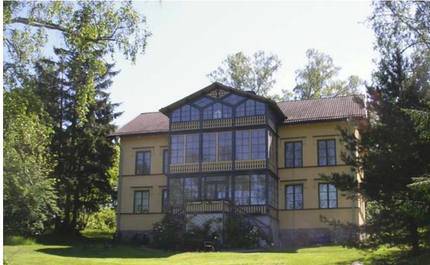
Stenhuset på Rörsundaön, Vikinghills enda stenbyggnad.