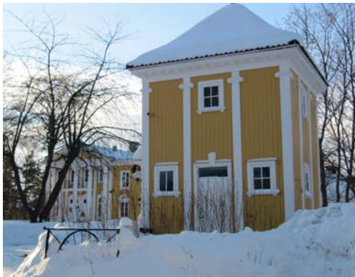
Almdalens entré med torn. Foto 2010