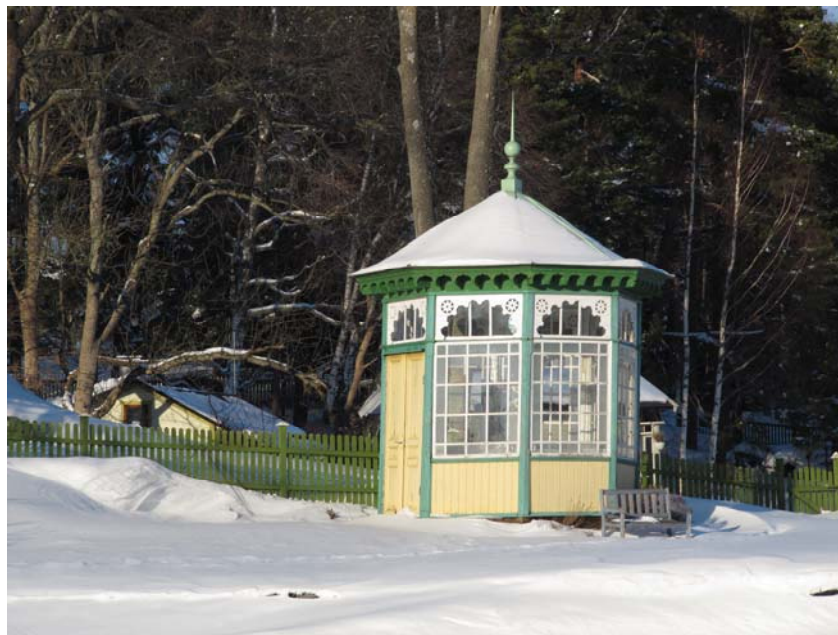
Lusthus nära Gustavslund, fasad mot Maren 2010.

Alldeles vid Marens inlopp, på en udde av Rörsundaön, ligger ett åttkantigt lusthus från 1888, enligt Resare "avsedd för kräftfester" (sid 39). Den festliga karaktären understryks av etsade glasrutor och mängder av konstfullt utformade fasaddetaljer. Från början låg en bro från lusthuset till fastlandssidan, den revs dock 1978 i samband med muddringsarbeten. Enligt äldre bilder gick en anlagd strandpromenad utmed vattnet nedanför lusthuset. I litteraturen förknippas lusthuset med Gustavslund.