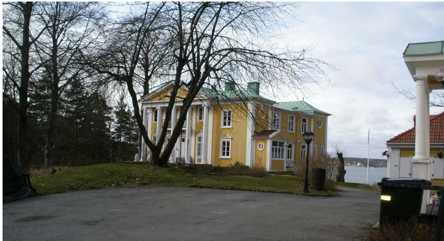
Almdalens gårdsfasad, till höger skymtar annexet.