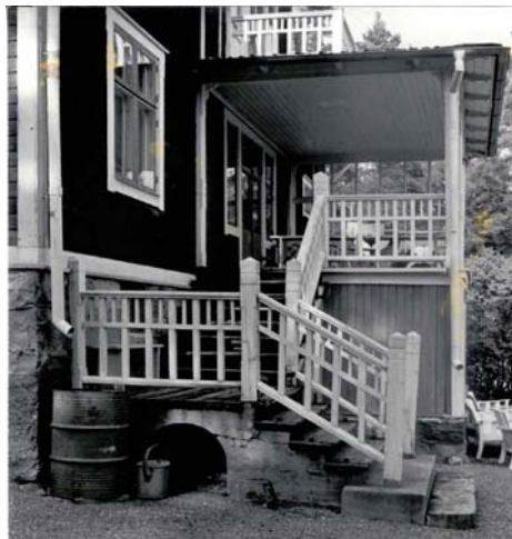
Verandadetalj. Foto 1978