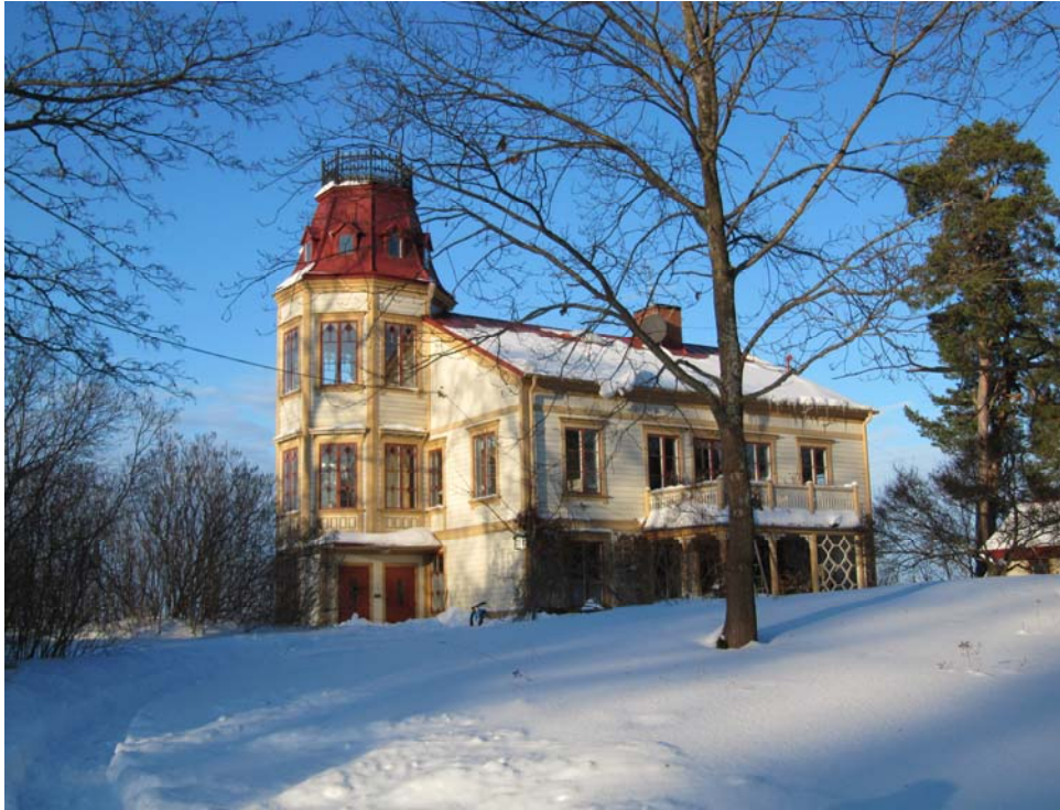
Karlshill, tidigare Blåsut. Foto 2010

farledssida står ett av Vikingshills mest säregna lusthus byggt omkring 1900, benämnt ekotempel, med kolonner och kupoltak. Vid stranden finns ett båthus från 1900-talets första årtionden, ligger idag dock på mark som tillhör Almdalen.