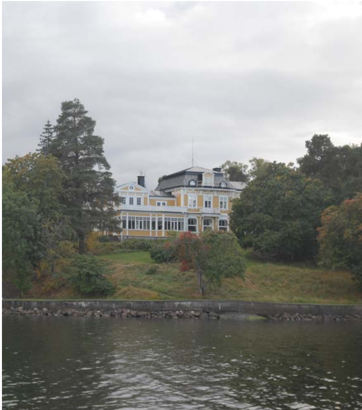
Björkudden. Foto 2009