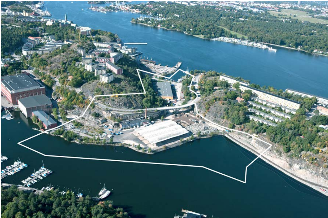
Flygbilden visar projektområdets geografiska läge och preliminära avgränsning