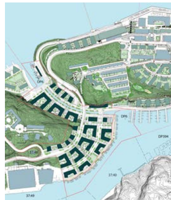
Planskiss 2014 utan utfyllnad