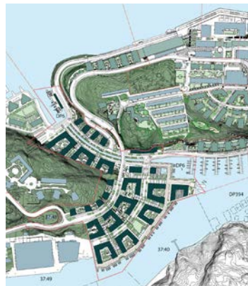
Planskiss 2014 med utfyllnad