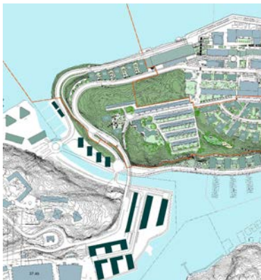
Planskiss enl. planprogram 2006

Tidigare etapper av Kvarnholmsprojektet har inletts utan eget start-PM. Det antagna planprogrammet har varit tillräckligt stöd för att starta detaljplanarbetet. I detta fall avviker dock exploateringsgraden så pass mycket från programmet att en separat start-PM bör antas politiskt. Eftersom kravet på program numera är avskaffat enligt ändring i plan- och bygglagen 2010, är det emellertid inte nödvändigt att revidera planprogrammet från 2006.