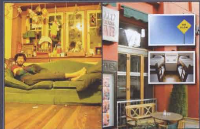
MEN OCKSÅ FÖR DEN NYA TIDENS UPPLIVSETURISTER ATT FÅ BO MITT I UPPLIVSELEN, ATT VARA EN DEL AV PLATSENS SJÄL OCH AKTIVITET