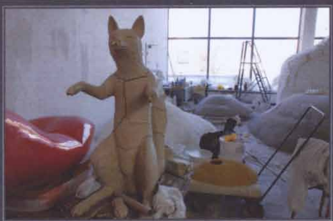
1. FUNKTIONELLA LOKALER MED NYA VERKSAMHETER