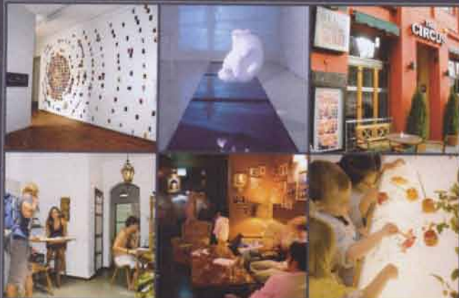
FORMULERA EN UTMANANDE VISION FÖR FRAMTIDEN KONSTHALL, HÖSTEL, KONSTNÄRSCAFÉ, FÖRSKOLA MED KONSTINRIKTNING