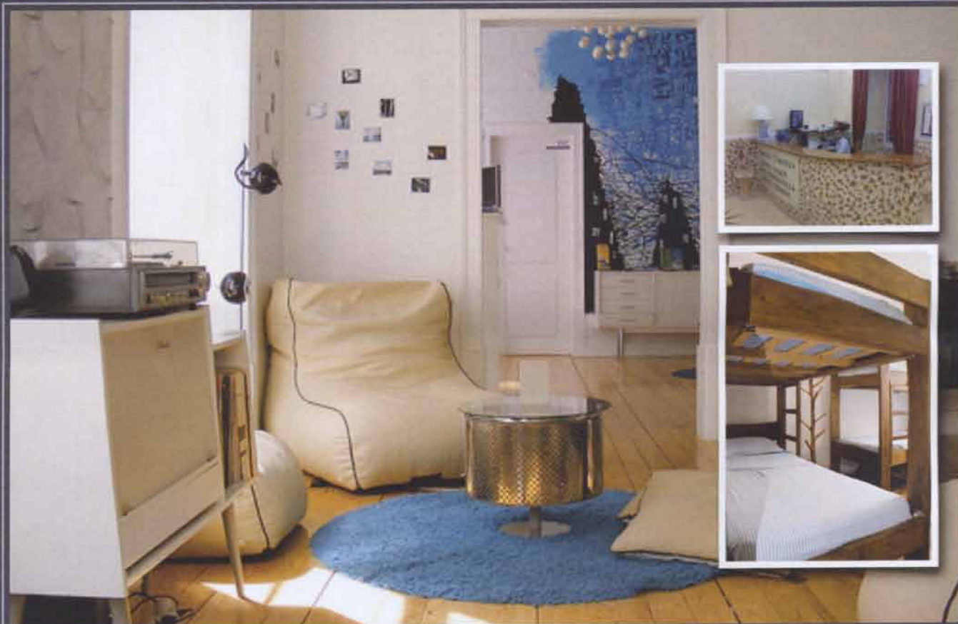
3. BO MEDAN DU ARBETAR, UNDER VETTIGA FORMER