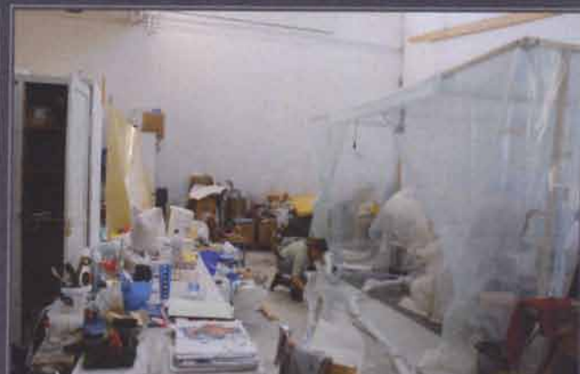
VISA ATT VI ÄR EN DEL AV DEN BÄSTA OFFENTLIGA KONSTEN VI VILL BIDRA TILL ATT GÖRA KKV TILL EN STOLT DEL AV NACKAS KULTURELLA PROFIL