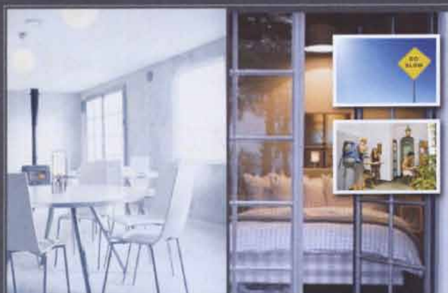
VI KAN SKAPA DEN NYA TIDENS VANDRARHEM ÅTERBRUK, SJÄLVHUSHÅLL, KONSTIDENTITET, BILLIGT BOENDE FÖR GÄSTANDE KONSTNÄRER