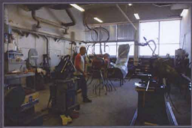
2. HYR ATELJÉ OCH ARBETA MED UNIKA FÖRUTSÄTTNINGAR