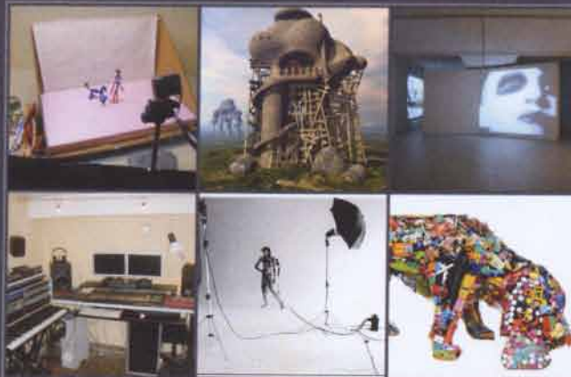
UTÖKA VERKSAMHETERNA MED NYA ATELJÉDELAR ANIMATION, DIGITAL ART, VIDEO ART, LJUD- OCH FILMSKAPANDE, PLAST MM