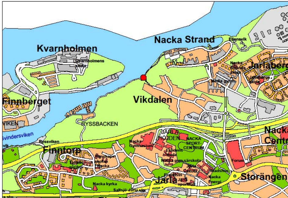
Planområdets läge i kommunen