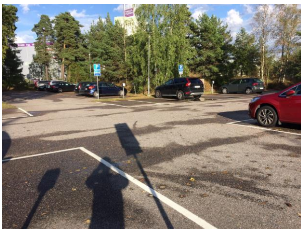
Stadshusets parkering närmast Nacka Forum

Alla verkar vara överens, vad väntar vi på? – Kommunledningen har tidigare uttalat sig positivt till att bygga modulbostäder för flyktingar men eftersom det gått lite trögt med att hitta bra platser så kommer jag här med ett konkret förslag.