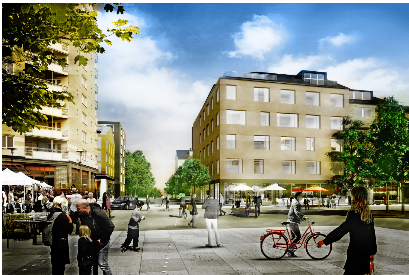
Nya Älta torg, vy från norr.