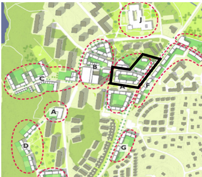
Samtliga planerade etapper inom detaljplaneprogrammets område.

Markanvisningsområdet ligger i direkt anslutning till Älta centrum, mellan Ältavägen och Oxelvägen. Området som avses för anbudstävling består av två kvarter indelat i tre anbudsområden. Marken består idag av en blandning av bebyggd mark (förskola), parkmark, enstaka träd, gräsytor och befintliga gång- och cykelbanor. Höjderna varierar mellan +31.5 och +35 meter. Se även bilagd primärkarta.