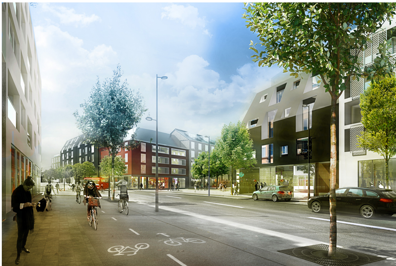
Bilden visar hur Ältavägen kan komma att se ut när den omvandlats till en mer stadsmässig gata. Till höger i bilden syns delar av det kvarter som tävlingen avser.