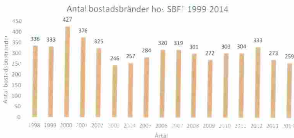
Figur 1. Antal bostadsbränder hos SBF 1999-2014 (MSB, 2016).

Majoriteten av bostadsbränder sker i flerbostadshus och i ungefär två tredjedelar av fallen begränsas branden till startföremålet. Det absolut vanligaste startutrymmet är köket och huvudorsaken till att det börjar brinna är oftast mänskliga handlingar. I områden med låg medelinkomst är det generellt sett fler bostadsbränder per invånarantal. I de fall där människor omkommer är äldre personer överrepresenterade och då sker det oftast under kvälls- och nattetid. Vid dödsbränder är det vanligaste startutrymmen vardagsrummet och sovrummet. 1