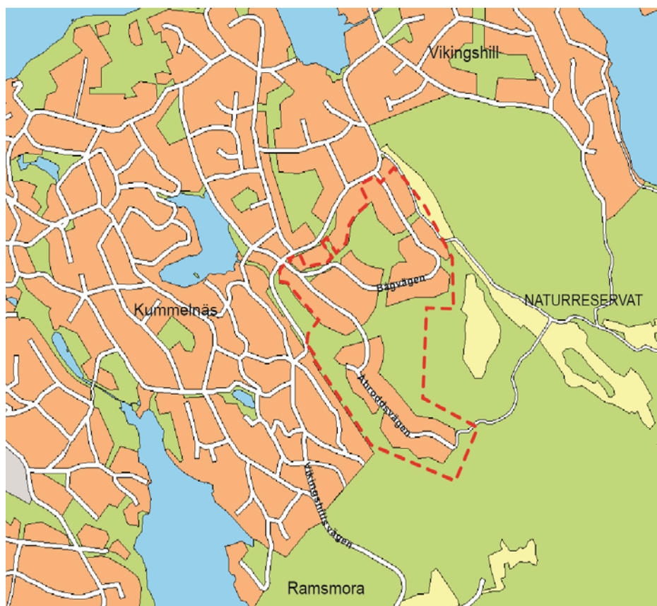
Gräns för förslag till detaljplan för område Bågvägen/Åbroddsvägen