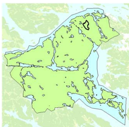
Planområdets läge i kommunen