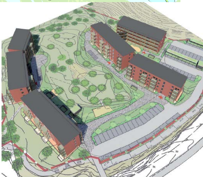
FLYGVYILLUSTRATION ÖVER KVARTER