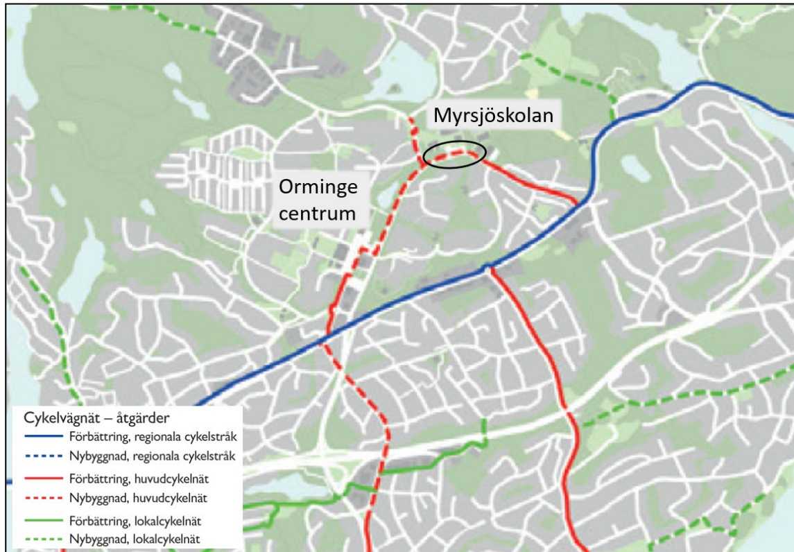
Figur 1. Urklipp från åtgärdsplanen i kommunen cykelstrategi. Den svarta ovalen markerar sträckan för den föreslagna investeringen.

För närvarande byggs en gång- och cykelväg från Sarvträsk, där anslutning till befintliga gång- och cykelvägar utmed Mensättravägen görs. Vid korsningen Mensättravägen och Skarpövägen anläggs en ny cirkulation för att möjliggöra en ny gång- och cykelöverfart över Skarpövägen. Där tar den föreslagna sträckningen vid och passerar Myrsjöskolan och sportcentrum för att sedan ansluta till befintlig gång- och cykelväg i höjd med Storholmsvägen, se figur 2. Den föreslagna gång- och cykelvägen är cirka 430 m lång med en bredd på 3,5 m.