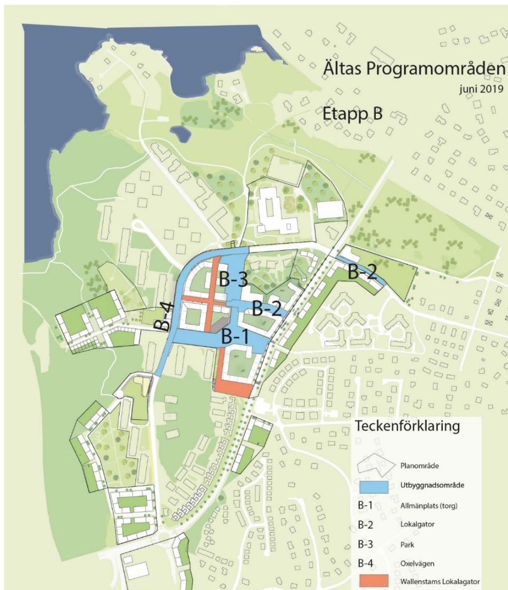
Figur 3, utbyggnad av centrumkvarteren, etapp B