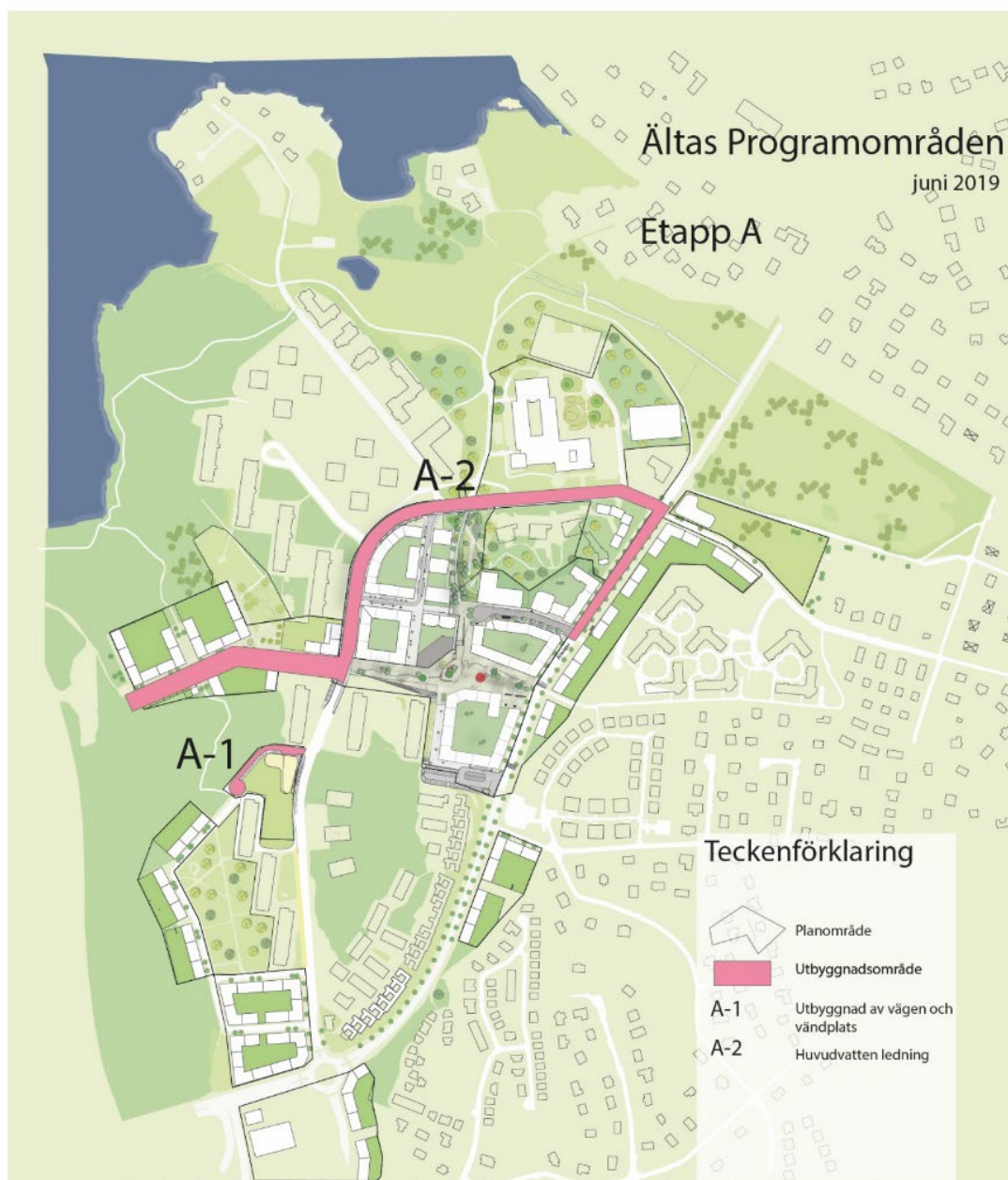
Figur 2, planerade och pågående åtgärder inom etapp A

Nacka vatten och avfall är med och delfinansierar projektet för huvudvattenledningen som förväntas vara klar vinter/vår 2019-2020.