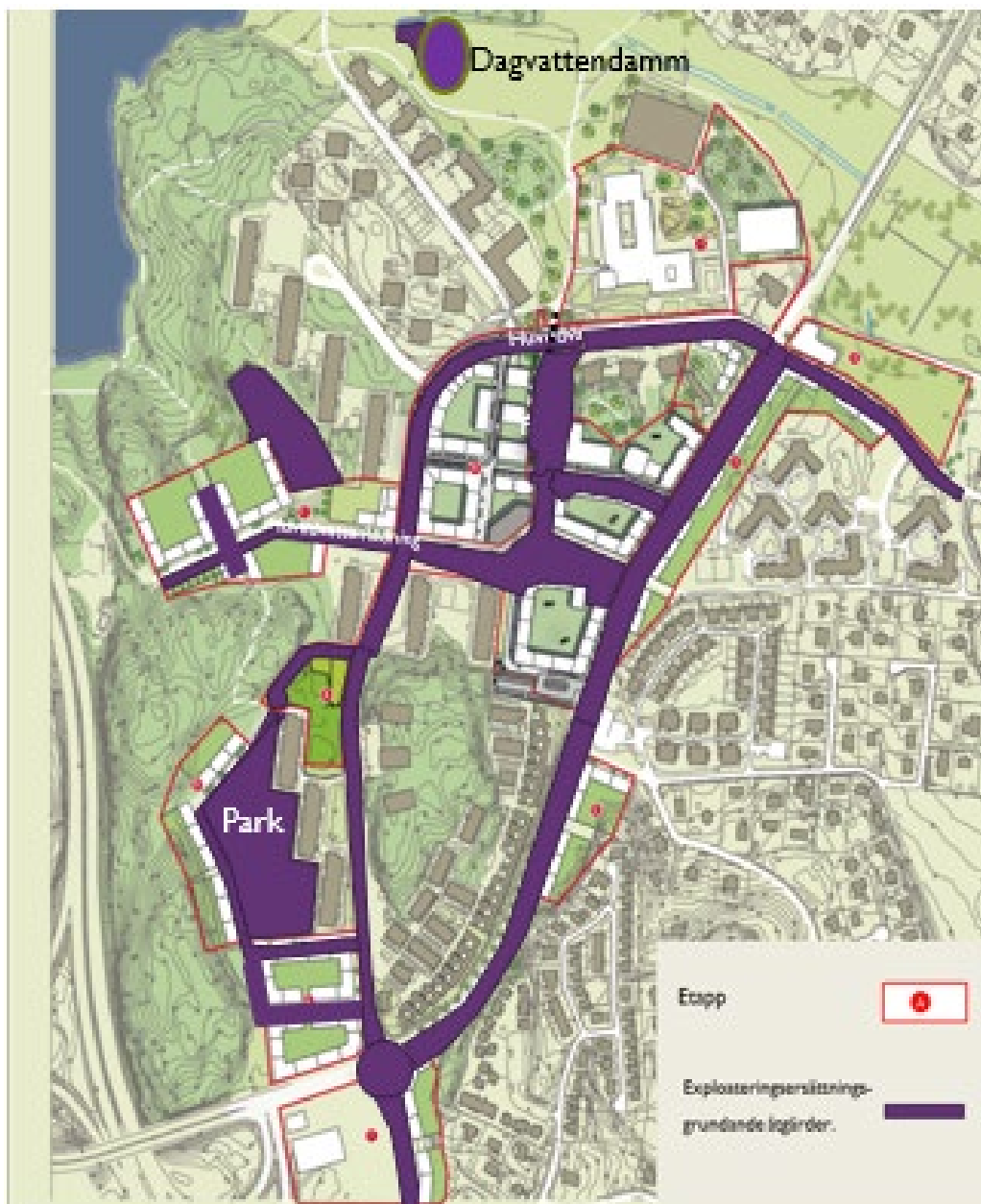
Figur 1. Innefattar alla allmänna anläggningar enligt programbehandlingen.