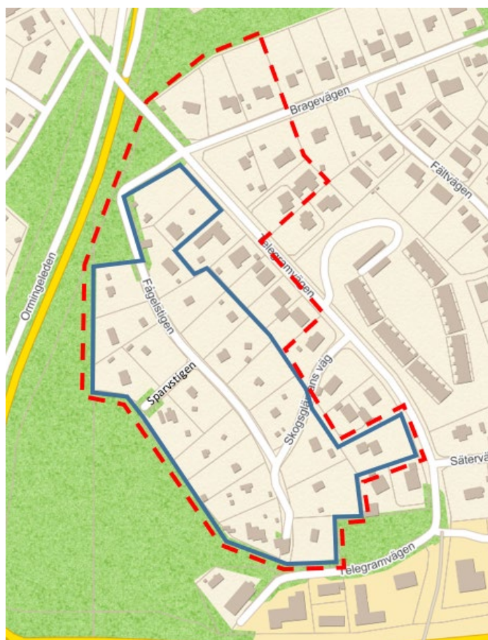
Kartan visar förslag till fördelningsområde med blå heldragen linje. Detaljplanens område visas med röd streckad linje.

I Fågelstigen avses kostnaderna enligt kostnadsunderlaget fördelas områdesvis. Fördelningsområdet innefattar fastigheter längs Fågelstigen, Skogsgläntans väg, Sparvstigen och Telegramvägen. Fördelningsområdet skiljer sig från planområdet, se kartan nedan. En sammanställning av samtliga fastigheter som ingår i fördelningsområdet finns i bilaga 1 .