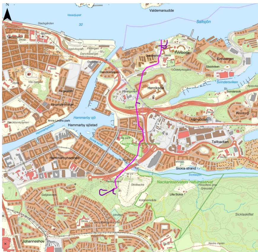
Figur 1. Karta över området. Det lila strecket visar tunnelns sträckning

Stockholm Vatten AB planerar att bygga en dagvattentunnel, Nya Östbergatunneln, från Hammarby höjden i Stockholm via Sickla i Nacka och ut i Saltsjön vid Finnroda. Syftet med Nya Östbergatunneln är att avlasta reningsverket i Henriksdal. Utbyggnaden av dagvattentunneln planeras ske mellan 2022 och 2025. En del av kommunens stadsbyggnadsprojekt på Västra Sicklaön, främst Henriksdal, Danvikshem och Finnroda varv kan komma att beröras.