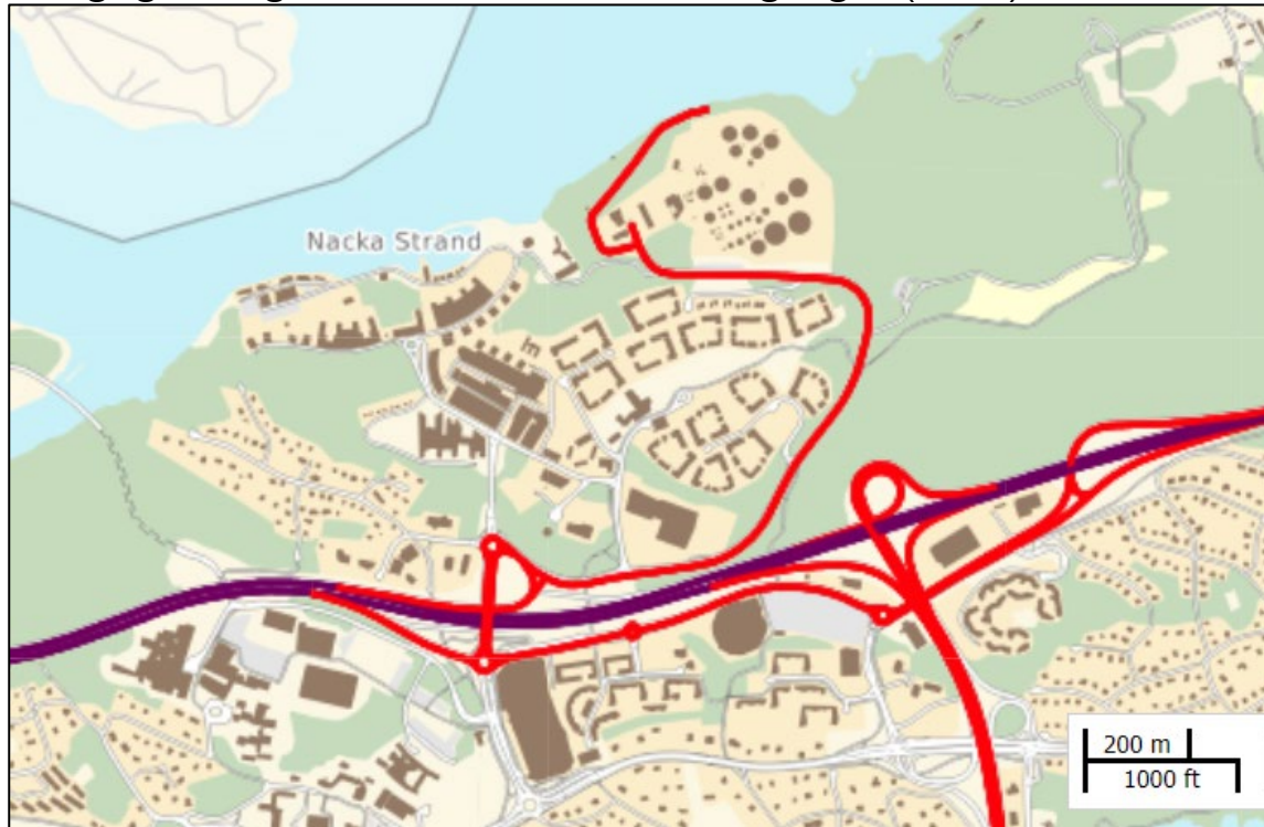
FIGUR 1. Primärt rekommenderat farligt godsvagnät = lila (väg 222). Sekundärt rekommenderat farligt godsvagnät = röd