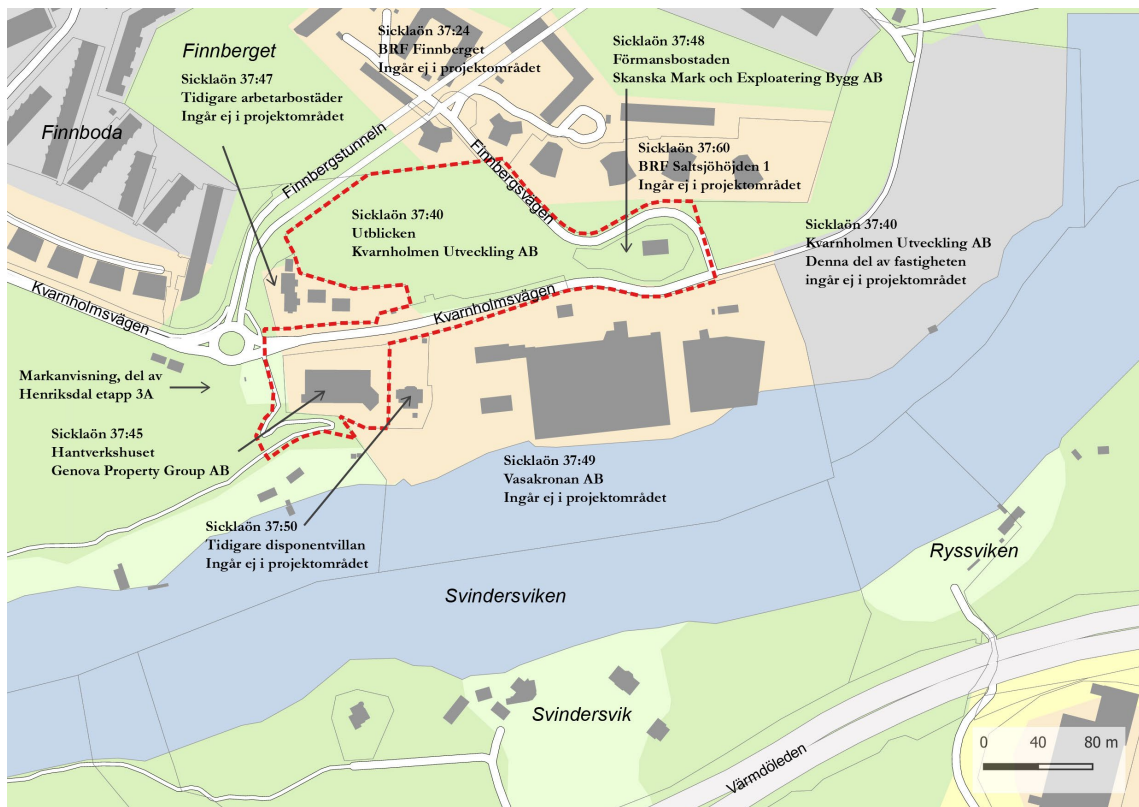
Karta som redovisar markägoförhållanden samt projektområdets avgränsning.