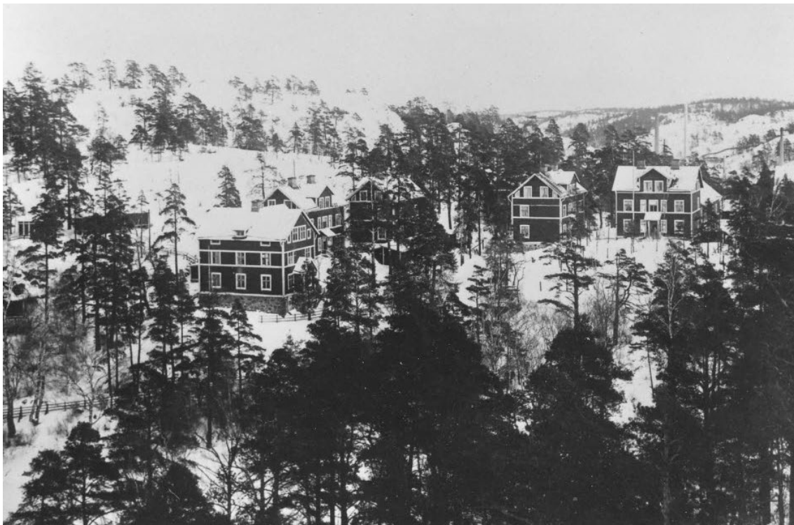
Till höger syns den bebyggelse på Hantverkshusets fastighet som revs under 1980-talet. Till vänster de arbetarbostäder som finns bevarade på Kvarnholmsvägens norra sida. I bakgrunden syns Finnberget.

Öster om projektområdet etablerades på 1600-talet ett beckbruk på fastigheten där Operan/Dramaten har sina lokaler idag. Verksamheten var sannolikt den första industriella etableringen vid Gäddviken. Stockholms superfosfatfabrik grundades 1871 och det blev startskottet för den industriella revolutionen på Kvarnholmen. Fabrikens huvudbyggnad låg öster om projektområdet, men arbetarbostäder uppfördes inom projektområdet.