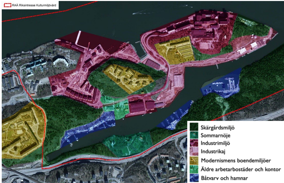
Karta hämtad från PM Förhållningssätt för hantering av riksintresset för kulturmiljö i området kring Svindersviken, Nacka kommun, 2022-01-18.

De av riksintressets uttryck som är relevanta för närområdet runt Svindersviken är uttrycken ”Farledsmiljö, kommunikationsmiljö, kust- och skärgårdsmiljö samt ’Industrimiljöer’”. Av riksintressebeskrivningen framgår vad som avses med de olika uttrycken.