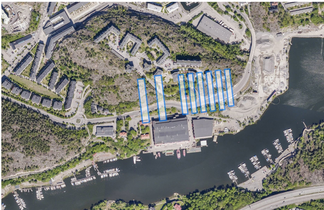
Objecisternernas läge under mark markerat på ett ortofoto.

För att berggrummen ska kunna tas i bruk för nya användningar krävs godkända miljöprövningar och andra myndighetsbeslut. Hur berggrummen ska saneras från kvarvarande miljöföroreningar, och vilka typer av verksamheter som är lämpliga i berggrummen, kommer att visa sig i den kommande miljöprövningsprocessen som sker parallellt med planarbetet. Brandsäkerhet och utrymning samt ventilations- och hisschakt upp till markytan är andra viktiga frågor som behöver lösas om berggrummen ska kunna tas i bruk för nya användningar.