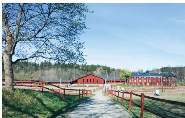
Preliminär vy och planritningar på nyanläggning

Ett nytt stall sammanlänkat med ett nytt ridhus uppförs. Ridhusen, befintligt ridhus och ponnyridhuset slås ihop och ett stort ridhus byggs i stället med en skiljevägg. I stall- och ridhusbyggnaden inkluderas de funktioner som ridskolan behöver för att kunna bedriva sin verksamhet såsom reception och entré, stallgångar, sadelkammaren, foderkammare, gödselstack, städförråd, förråd persedelvård, tvättstuga, spol-/veterinär-/hovslagarstilla, personalrum med pentry och omklädningsrum, chefskontor, teorisal och cafeteria, ridhus, domartorn och hinderförråd.