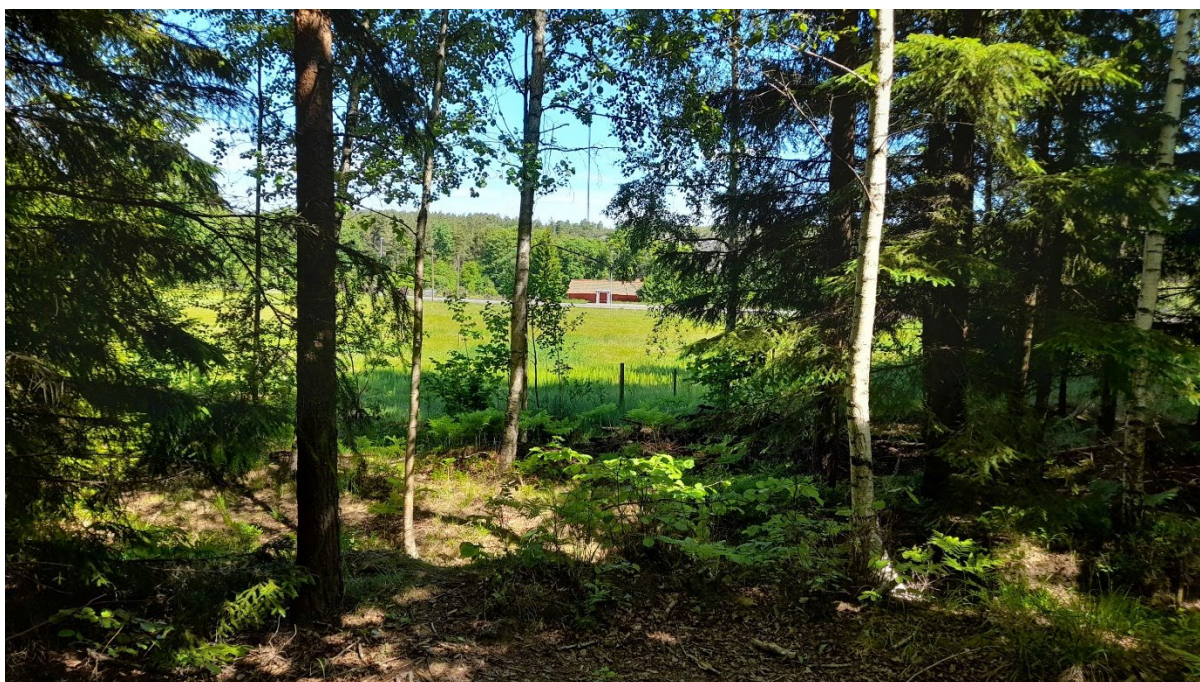
Figur 4 Från stigen söder om odlingsmarken ser man in över Källtorps gamla åkermark och ekonomibyggnader.

Argumentet att den samlade kulturmiljön inte kan upplevas av besökaren står dessutom i skarp kontrast till kommunens förslag till kompensationsåtgärder, där man bl.a. föreslår att informera om Källtorps kulturhistoria och gravfältet genom skyltning, samt genomföra återkommande fornvårdande röjningsåtgärder på gravfältet. Denna skyltning och fornvård har rimligtvis till syfte att dra mer besökare till Källtorps kulturmiljö. Men från det aktuella gravfältet öster om odlingsmarken kommer man inte att kunna uppleva sambandet med bebyggelsen och odlingsmarken om fotbollsplanerna kommer att byggas. Det framgår av kommunens egen websida om fotbollsplanerna. 1 Gravfältet, bebyggelsen och odlingsmarken bildar givetvis en samlad helhet i denna mycket speciella kulturmiljö.