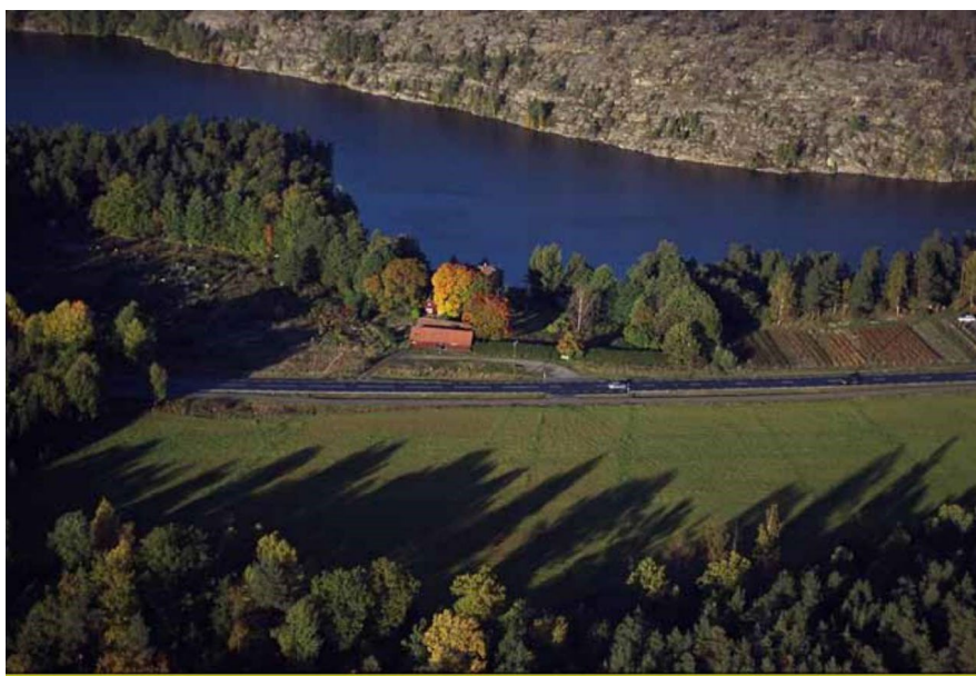
Figur 1. Odlingslandskapet vid Källtorps prästboställe. Även återgivet i Riksantikvarieämbetets kunskapsunderlag för Riksintresset Erstavik 2019-12-03

I Riksantikvarieämbetets kunskapsunderlag för Erstavik skriver man om förhållningssätt: ”Torpbebyggelsen som utmärks av att husen är enskilt belägna och har hög känslighet för tillkommande ny bebyggelse och vegetationsförändringar. Den småskaliga bebyggelsekaraktären är känslig för utbyggnader och ändringar av arkitekturen.” Att vegetationen runt torpen skulle ersättas av konstgräsplaner verkar inte ha föresvävat de som på Riksantikvarieämbetet nyligen uppdaterade detta underlag. (Kunskapsunderlag Riksintresset Erstavik 2019-12-03 Riksantikvarieämbetet).