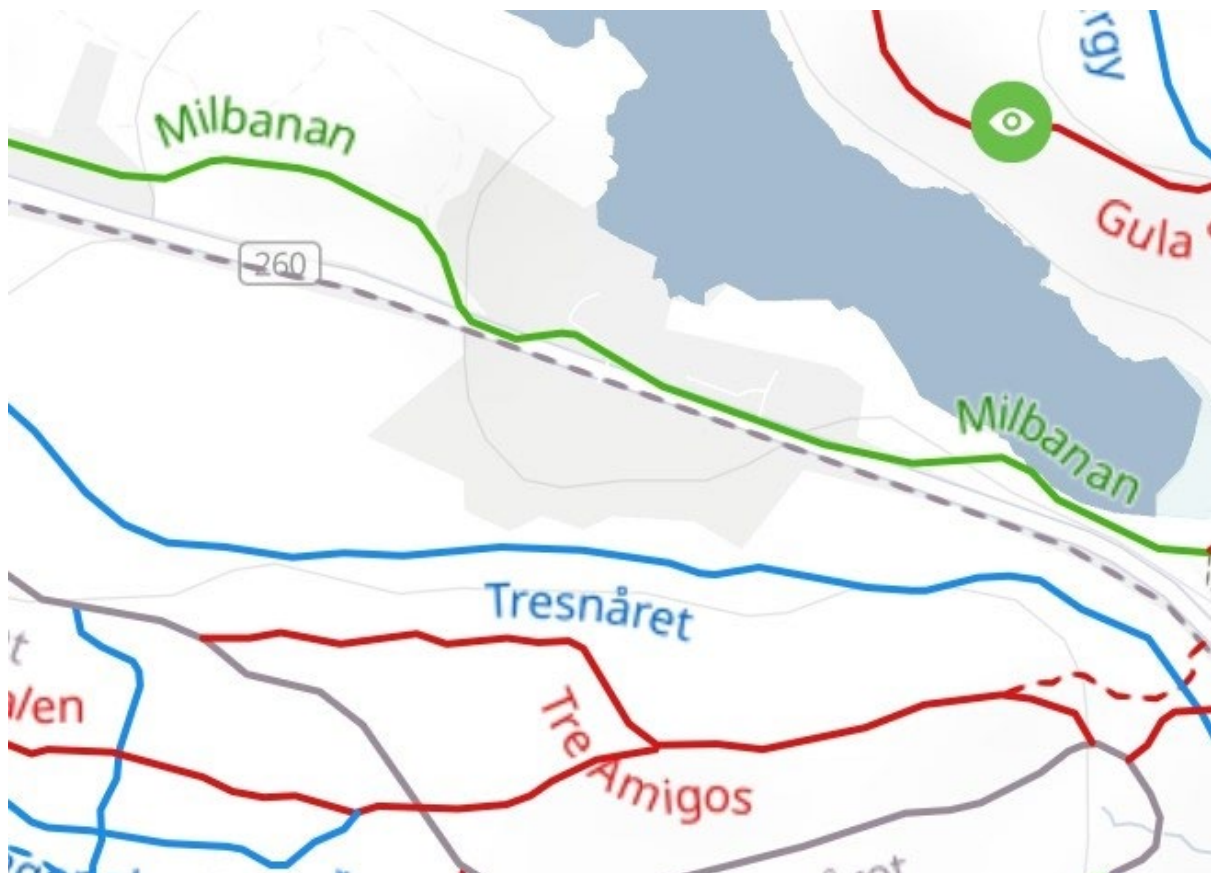
Figur 3 I Stigar vid Källtorp enligt appen Trailforks