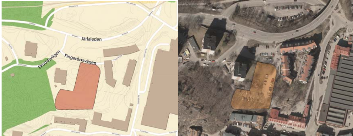
Fastighetsgräns för Sicklaön 125:3 och detaljplanens preliminära avgränsning.