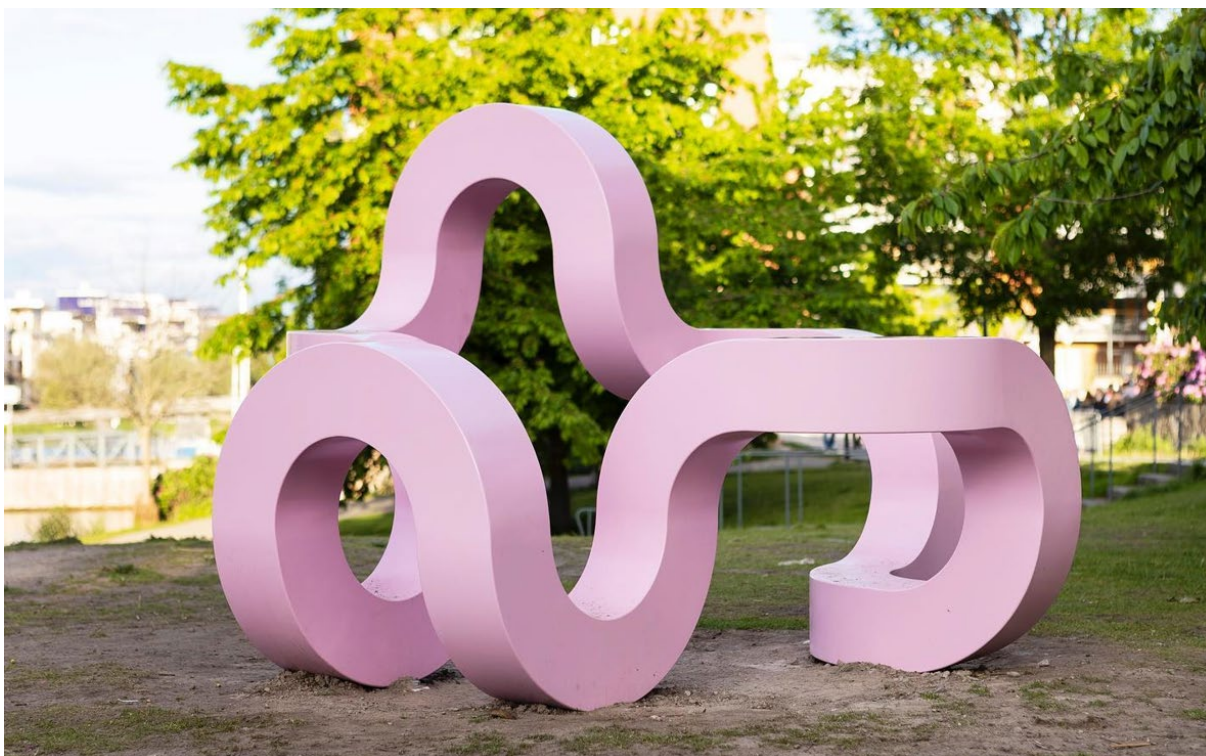
Figur 7, Jacob Dahlgren Eternity Sculpture foto Ryno Quantz.