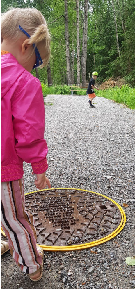
Figur 6, Brunnslocksposi, Mensättra våtmark Boo