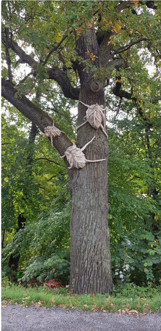
Figur 4, I figur 3 är de stora hjärtanen i träden "Oness" visar på konst som inte bara är en skulptur på marken, utan utmanar både materialen och placeringen. Ida Bentinger Oness, Sickla strand.