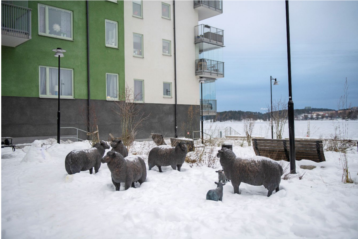
Figur 2, "Får" från Tollare, vilka har blivit en mötesplats för boende och besökare i området. En skulptur där barn leker och klappar, medan de vuxna spelar boule bredvid. Får Alline Magnusson. Tollare.

Nedan visas fyra konstverk, som är goda exempel på hur den konstnärliga formen i Älta centrum kan komma att se ut.