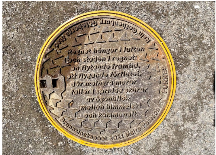
Figur 5, Brunnslocksposin, i exemplet nedan en dikt om regn, placerat på en gångväg. Ett oväntat konstverk som får besökaren att stanna upp och som manar till eftertanke och lugn. Ett exempel på konst integrerat i markmaterialet.