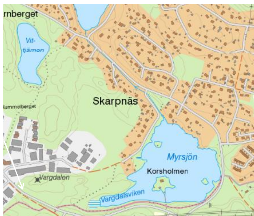
Figur 2.1: Översikt över Myrsjön, Korsholmen samt utlopps bäcken mot Kvarnsjön.

Idag har en provisorisk utloppströskel utformats av privatpersoner och utgörs av några plankor ca 60 meter ned i utloppsdiket. De boende vid framförallt utloppet ser gärna att befintlig vattenspiegel bevaras samtidigt som huset på Korsholmen inte skall utsättas för vatten vid höga flöden.