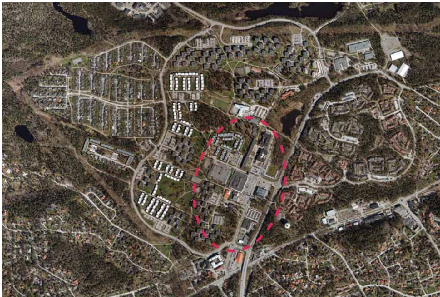
Flygfoto över centrala delen av kommundelen Boo. Programområdet Orminge centrum är markerat.