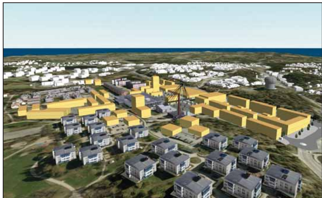
Illustration ur 3D-modellen som nås via nacka.se - de nya byggnaderna i gul ton.

Under samrådstiden finns det möjlighet att lämna synpunkter på programförslaget i en interaktiv 3D-modell på kommunens hemsida. Förslag och synpunkter kommer att sammanställas och användas i programarbetet. Länk till, och instruktioner för hur 3D-modellen används finns på www.nacka.se/ormingecentrum