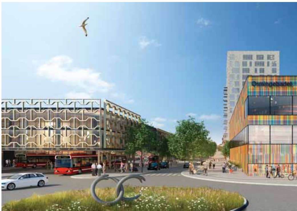
Mensättravägen vy mot bussterminal och badhus, i bakgrunden ett nytt landmärke, ett flerbostadshus i 16 våningar, illustration White Arkitekter