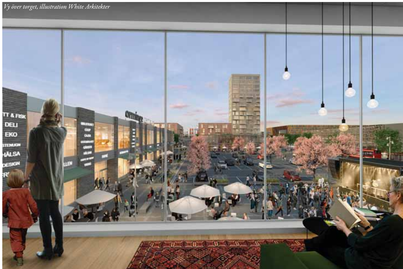
Vy över torget, illustration White Arkitekter

Ett planprogram är ett dokument som tas fram innan arbetet med de juridiskt bindande detaljplanerna påbörjas. Programmet ska ange förutsättningar och mål för planarbetet och uttrycka kommunens vilja och avsikter för området. De övergripande frågorna, som hur marken ska användas för bebyggelse, gator, torg, parker med mera ska utredas i ett tidigt skede. Programmet ska fungera som riktlinje inför kommande detaljplanarbeten. Programmet antas av kommunstyrelsen.