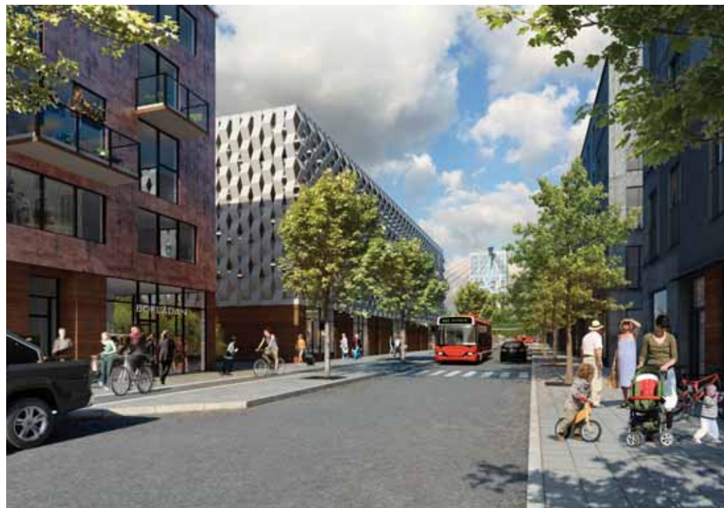
Kanholmsvägen vy mot centrum, med butiker och verksamheter i bottenvåningarna blir centrumet mer välkommande och är tryggare på kvällar och nätter, illustration White Arkitekter