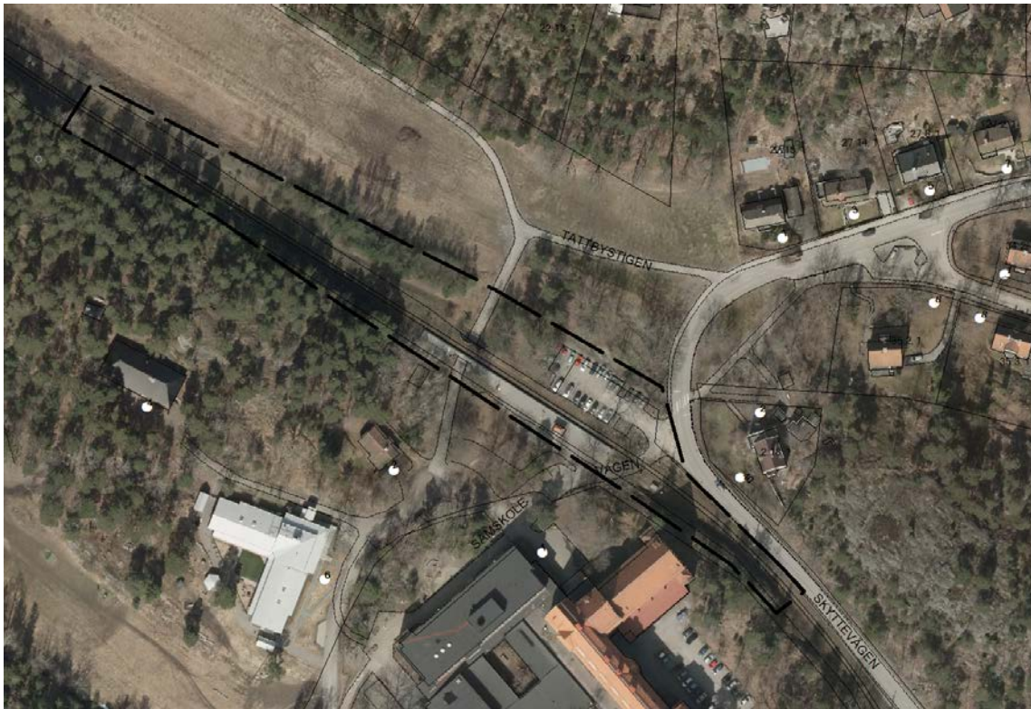
Kartan visar ett flygfoto över Tattby station med detaljplanens preliminära omfattning