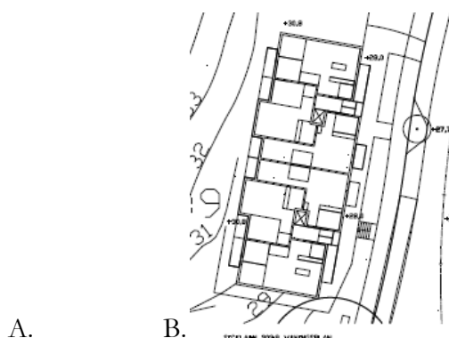
Figur 2. Föreslagen lägenhetslösning,

Med nuvarande utformning av huset innehålls Avstegsfall B, se figur 2.