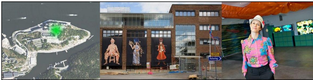
Fr v: Makaronis position på Kvarnholmen, fasadvy från makaroni.se (Makaroni, 2014), pressbild från Kvarnholmens hemsida (Kvarnholmen Utveckling AB, 2014).