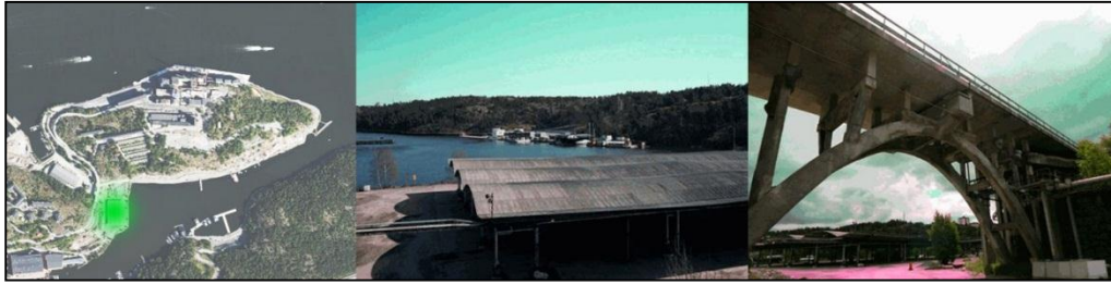
Fr v: YARD:s position på Kvarnholmen, pressbilder Allt om Stockholm (Eriksson & Rehnqvist, 2014)