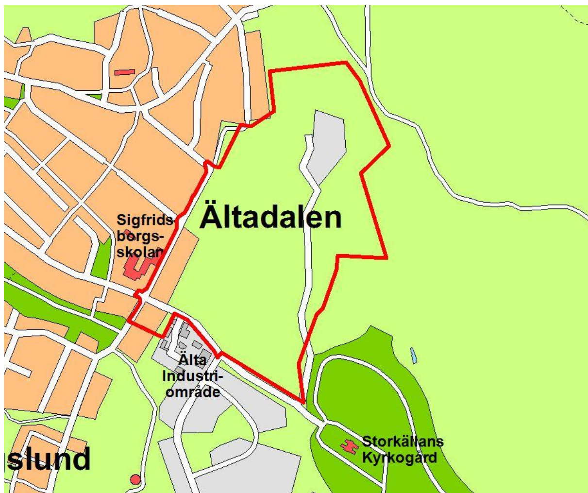
Bild 1. Planområdet

Planområdet ligger i östra delen av Älta och omfattar en areal om drygt 33,6 ha. Området begränsas i öster av Storkällans kyrkogård och naturmark som hör till Erstavik – i norr av resterande del av Erstavik 25:32, i väster av bebyggelsen på Åsvägen och Lovisedalsvägen, samt i söder av Storkällans väg. Områdets avgränsning framgår av bifogad karta (bild 1).