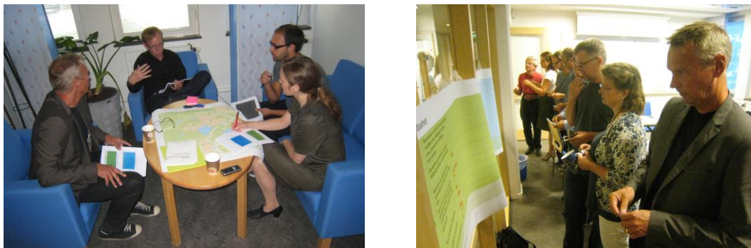
Figur 4. Bilder från workshop

Efter en inledande beskrivning av Ältaområdet delades deltagarna in i fyra grupper utifrån de olika hållbarhetsområdena ekologisk, ekonomisk, strukturell och social hållbarhet. En tabell på exempel på aspekter att beakta för respektive område delades ut. Efter redovisning av respektive grupp genomfördes en omröstning bland samtliga angående de viktigaste frågorna att fokusera på inom respektive område. Ett andra grupparbetsmoment syftade till att formulera de tre viktigaste målsättningar för vardera av de fyra aspekterna. Detta gav ett resultat på tolv prioriterade hållbarhetsmålsättningar som redovisas nedan under punkt 4.3. Målen färgkodades i enlighet med de olika hållbarhetsaspekterna: