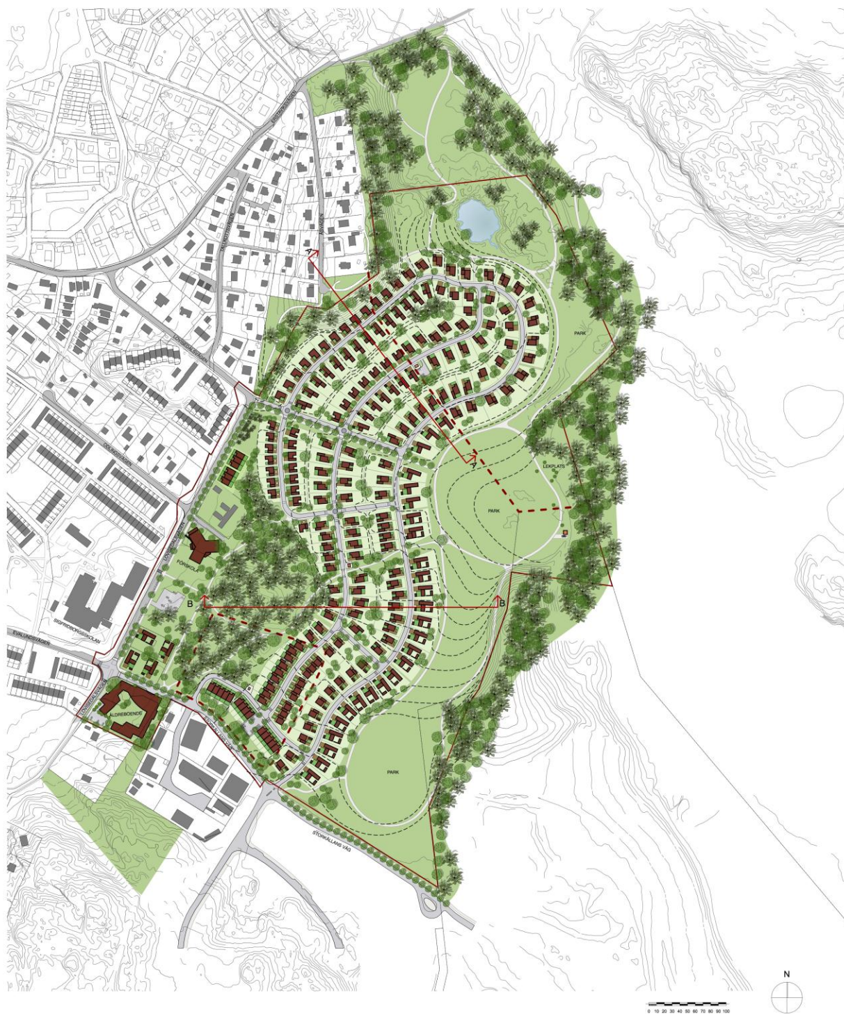
Bild 2. Illustration till detaljplan för Ältdalen, ÅWL arkitekter

I en illustration till detaljplanen som har tagits fram av ÅWL arkitekter redovisas tänkbar bebyggelse. Bebyggelsen föreslås huvudsakligen bestå av friliggande småhus (villor och radhus), samt förskola och äldreboende. De östra och norra delarna lämnas obebyggda som en del av ett större parkstråk genom Älta och vidare ut mot Erstavik (bild 2).