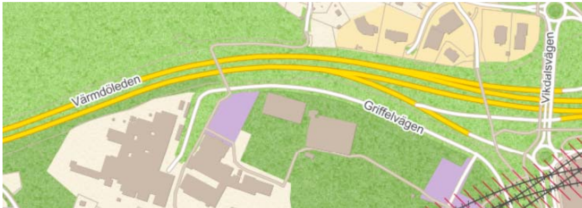
Bild 3: En eventuell depå i Nacka kommun skulle enligt lokaliseringstudien förläggas inom detta område.

En eventuell järnvägsplan för depå i Nacka kommun kommer i sådant fall att samordnas med en detaljplan för depå.