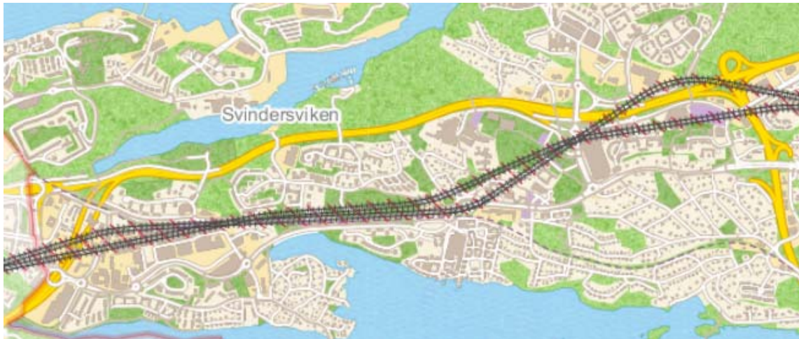
Bild 4: Detaljplanen kommer att ha samma avgränsning som järnvägsplanen. I syfte att skapa bättre stationslägen har Nacka kommun begärt ett justerat spåråläge (i förhållande till det spåråläge som tidigare redovisats) varför två varandra närliggande spårdragningar visas på kartan. Exakt spårdragning bestäms i järnvägsplanen.

Marken på sträckan ägs av både privata fastighetsägare, Staten och av Nacka kommun. Större delen av detaljplanen gäller för en tunnel minst 20 meter under marknivå. Detaljplanens bestämmelser ska bland annat ge förutsättningar för utbyggnad av tunnelbanan och medge tredimensionell fastighetsbildning. Detaljplanen bedöms enbart påverka markanvändningen vid stationsentréer. När detaljplanen är genomförd bedöms den därför ha liten påverkan på ytlägen. Projektet bedöms därför inte ha negativ påverkan på tidplaner och förutsättningar för övrigt detaljplanarbete på västra Sicklaön. När mark inom tunnelbanesträckningen i framtiden planläggs för annan verksamhet än tunnelbana kommer dessa detaljplaner även medge tunnelbana genom planbestämmelser.