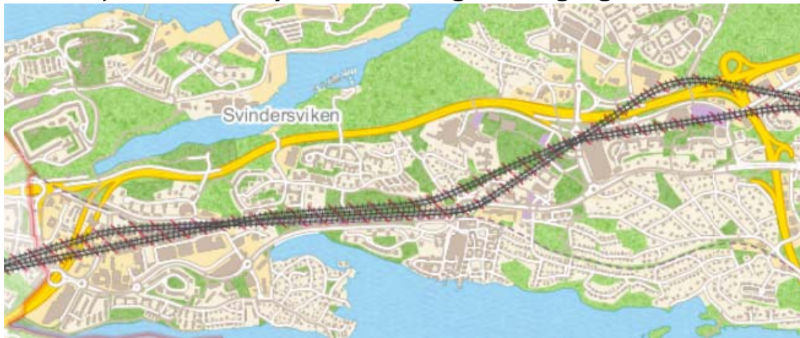
Bild 2: Kartbilden visar Projektets geografiska läge. Projektområdet begränsas till samma område som järnvägsplanen. I syfte att skapa bättre stationslägen har Nacka kommun begärt ett justerat spårläge (i förhållande till det spårläge som tidigare redovisats) varför två varandra närliggande spårdragningar visas på kartan. Exakt spårdragning bestäms i järnvägsplanen.

I detta projekt blir stationen i Nacka C slutstation för tunnelbanan, men spåren kommer att fortsätta efter stationen för att möjliggöra uppställning av tåg. Längden på dessa stickspår är ännu inte klarlagd. En idéstudie har genomförts för en framtida förlängning av tunnelbanan till Orminge 1 , och det säkerställs att projektet Tunnelbana till Nacka inte möjliggör en sådan förlängning.