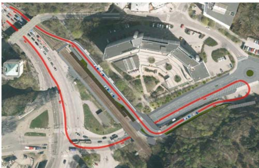
Det röda strecket längst till vänster visar hur bussarna kommer på Värmdövägen från stan och kör vänster in på Kvarnholmsvägen under järnvägsbron.

Den nya hållplatsen, där man stiger av och på bussarna anläggs parallellt med perrongen vid Henriksdals station. Där ska bussarna stå och vänta när resenärerna stiger av tåget.