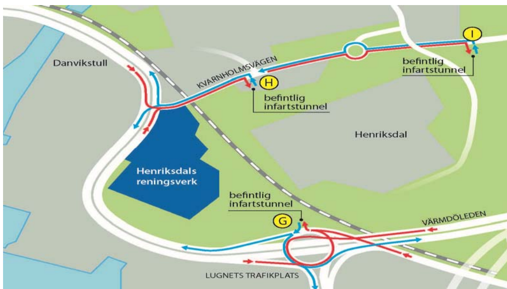
Bilden ovan illustrerar reningsverkets tre tunnelmynningar.

Utbyggnaden av reningsverket sker till stor del inne i berg. Men påverkan på den yttre miljön avseende transporter, utsläpp, skyddsavstånd m.m. gör att Nacka kommun inom arbetet med planprogrammet för Henriksdal har tagit fram en riskutredning för hur om- och utbyggnaden av reningsverket kan komma att påverka Nacka kommun. Främst avseende Nackas möjlighet att bygga bostäder i anslutning till reningsverkets tunnelmynningar. Denna riskutredning är under färdigställande våren 2015 och kommer att användas som ett underlag till det yttrande som Nacka kommer att lämna i samband med Stockholm Vattens tillståndsprövning (som hanteras av mark- och miljödomstolen) och som i Henriksdal endast krävs för ett fåtal av projektets alla åtgärder och arbeten.