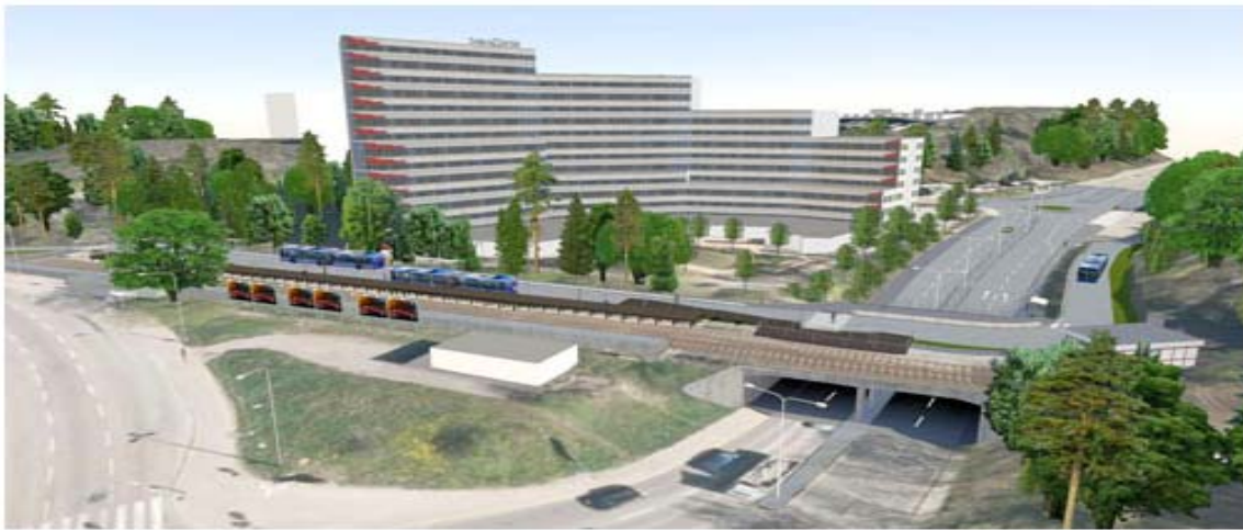
Ovan bild illustrerar den tillfälliga ändstationen, bussomstigningen, under projekt Slussens ombyggnad

Projektet har ingen definitiv geografisk avgränsning men hänger nära samman med planprogrammet för Henriksdal. Samtidigt som Nacka kommun diskuterar en stadsutveckling av Henriksdalsområdet har det varit nödvändigt att hantera ovan angivna projekt som innebär olika genomförandeåtgärder som skulle kunna påverka Nackas planerade stadsutveckling. När Henriksdals planprogram har antagits kan detta samordningsprojekt komma att ändra karaktär för att hantera frågor som också behöver hanteras i ett genomförande av Nackas stadsutveckling i Henriksdal. Andra aktuella processer som drivs parallellt av Nacka såsom Östlig förbindelse ingår inte i detta samordningsprojekt.