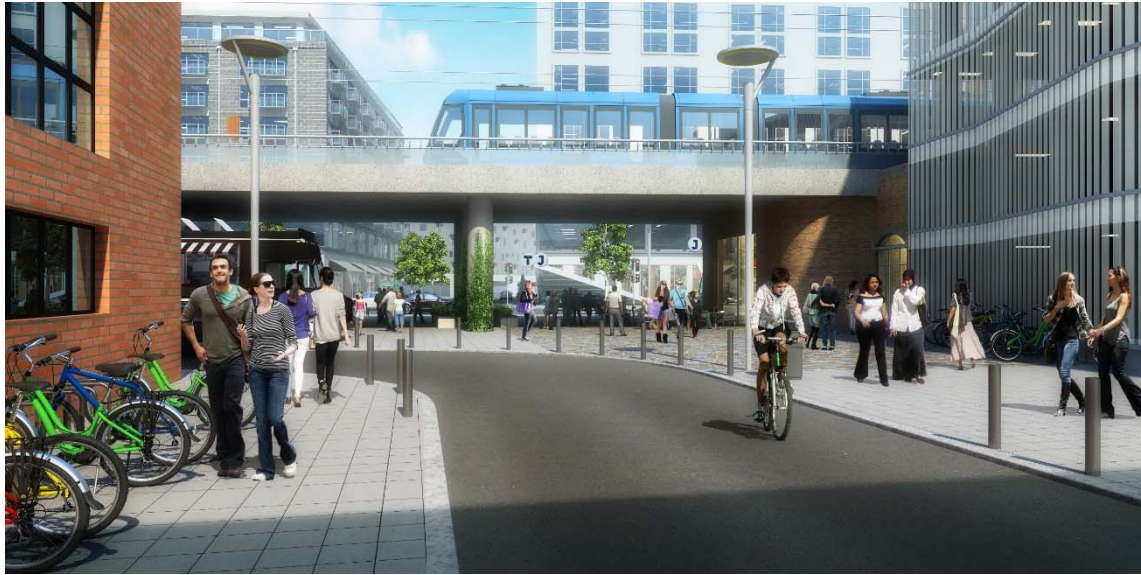
Vy norrut, föreslagen gång- och cykelkoppling till Värmdövägen under järnvägsbron vid Simbagatan