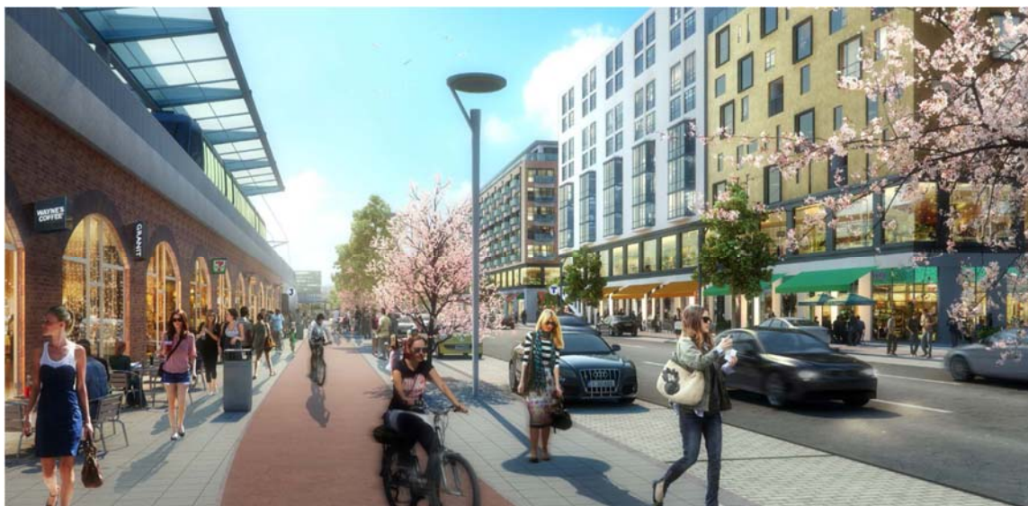
Vy västerut på Värmdövägen med Nacka station till vänster i bild.

Illustrationerna nedan är framtagna för att ge en övergripande bild av hur förslaget skulle kunna se ut i den planerade stadsmiljön. Bilderna visar förslaget med station inritad.