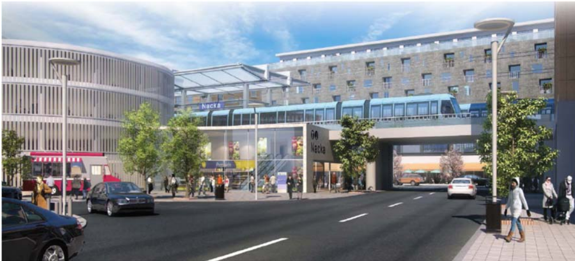
Vy norrut, föreslagen koppling till Värmdövägen under järnvägsbron vid Planianvägen.