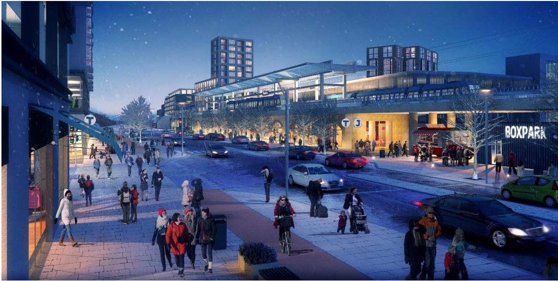
Vy österut på Värmdövägen under den mörkare delen av året.